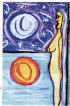
“Mi Sexualidad” página 9