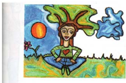
“Mi Sexualidad”, página 5