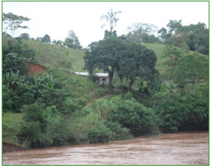
Río San Miguel

4) La región transfronteriza tiene que conformarse como un espacio particular de inclusión y un encuentro para equilibrar las desigualdades socioeconómicas, articular las diferencias de lo nacional y conectar los territorios distantes que le dan sentido a lo interfronterizo. Para que ello ocurra, se requieren políticas transfronterizas de seguridad ciudadana, así como políticas económicas, culturales, políticas y sociales. La frontera debe ser un espacio para el reconocimiento de la diferencia y no un lugar para la repulsión entre los Estados; porque, cuando ello ocurre, la única forma de integración existente es la de los ilegales (la legalidad se informaliza). Todo comercio ilegal produce dinero que algún rato debe lavarse. Es decir, hay una cadena de ilegalidades. Esta forma de violencia debería ser controlada desde el ámbito de la seguridad ciudadana.