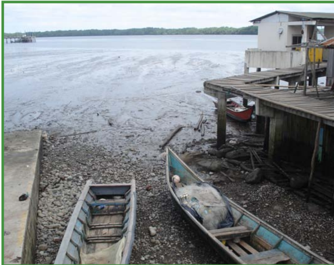
San Lorenzo