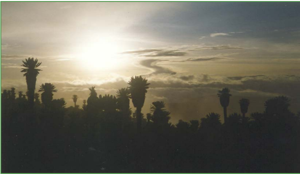
Páramo El Ángel

Las fronteras en la actualidad son expresiones de realidades múltiples, al extremo de que en una frontera se pueden encontrar varias en simultáneo; porque se trata de la confluencia de situaciones asimétricas y heterogéneas. No solo que existen diferencias frente al otro distinto, sino que también se presentan una multiplicidad de aristas, tales como: económicas, políticas, sociales y culturales. De allí que las políticas que se diseñen deban seguir esta lógica plural y no continuar con el error de tener una sola propuesta para la totalidad y que ésta sea elaborada de manera distante de la frontera y con desconocimiento de la misma.