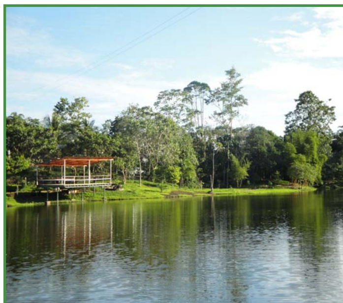
Lago Agrio

“Ahora el proceso está terminado y habría que preguntarse de qué manera se pueden profundizar estas medidas...”