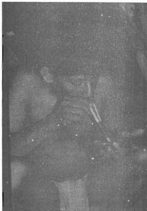
Chamán Piaroa inhalando yopo

Como vemos, estos aborígenes, igual que otros de diversas naciones, con una representación étnica significativa, son portadores, aún después de 498 años, de sus más variadas culturas la cual han defendido y recreado dentro de sus más grandes procesos etnocientíficos. Aquí también podemos mencionar el