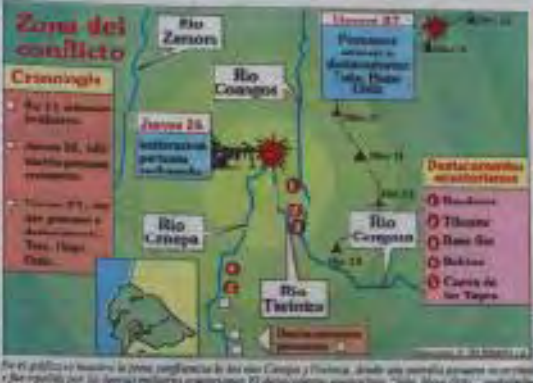
En el gráfico se muestra la zona conflictiva de los ríos Cuzco y Huánuco, donde una patrulla peruana se enfrentó a un grupo de Sendero Luminoso en el río Huánuco.

El presidente de la República, Alan García, declaró hoy estado de emergencia en las zonas de conflicto de la zona norte del país, en virtud de la gravedad de la situación que se vive en esas zonas y de la necesidad de adoptar medidas excepcionales para garantizar la seguridad y el bienestar de la población que vive en esas zonas.