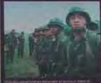
Unidades de la Fuerza Armada ecuatoriana en el campo de batalla.

El día de Crente es un día importante para el pueblo ecuatoriano. Se celebra en honor de San Sebastián, el santo patrono de los soldados. En este día, se realizan actividades religiosas y culturales en todo el país.