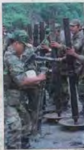
VEJAS DE LOS BARRIAZOS PERUANOS - La zona de combate que vive aquí desde hace meses parece haberse convertido en un campo de batalla.

La escalada de militares en la zona de combate que vive aquí desde hace meses parece haberse convertido en un campo de batalla. Los funcionarios de los países garantes del Tratado de Lima se encuentran en una reunión en la ciudad peruana de Arequipa, buscando una solución al conflicto que se ha desarrollado en la zona y que involucra a los ejércitos de los países garantes del Tratado de Lima.