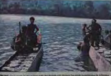
Los shuaras exigen la liberación inmediata de los detenidos y la devolución de sus tierras.