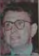
Marcelo Pinto, ex ministro de Comercio Exterior, es el nombre propuesto para el cargo de ministro de Finanzas.

Marcelo Pinto, ex ministro de Comercio Exterior, es el nombre propuesto para el cargo de ministro de Finanzas. Pinto tiene una amplia experiencia en el sector económico y financiero. Su nombramiento podría marcar un punto de inflexión en la política económica del país.