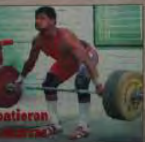
Se batieron los récords en la competencia de levantamiento de pesas en la ciudad de Quito. El atleta peruano logró levantar un peso de 150 kilogramos.

Los habitantes de Quito se sienten más organizados gracias a las acciones de las organizaciones populares. Estas organizaciones trabajan para mejorar la calidad de vida de la población.