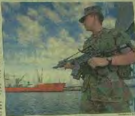
Constante vigilancia del mar territorial

QUITO. El Ministerio de Defensa informó que Ecuador mantiene sus posiciones en la zona de conflicto con Colombia. El ejército ecuatoriano no ha sufrido bajas y continúa operando en la zona. El gobierno ecuatoriano ha expresado su preocupación por la situación y ha llamado a la calma y a la negociación pacífica.