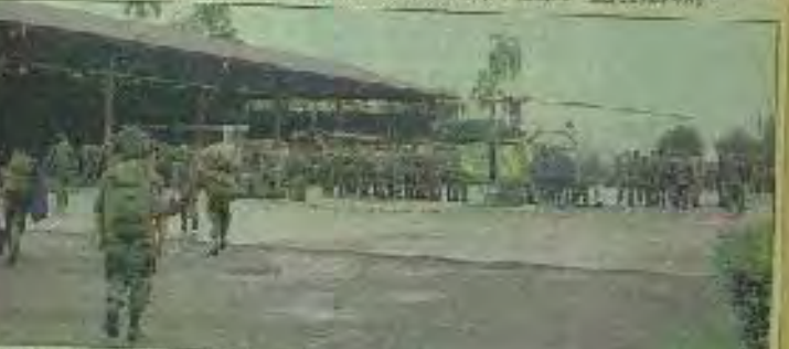
Centro de operaciones en el Oriente

El secretario de la Organización de Estados Americanos (OEA) llega a Ecuador. El secretario es el Sr. [Nombre]. El secretario de la OEA es el Sr. [Nombre]. El secretario de la OEA es el Sr. [Nombre].