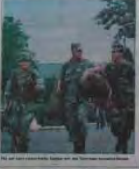
El lugar del incidente está dentro de nuestro territorio

El hecho de la matanza en Lumbador, Ecuador, que ocurrió el 26 de enero de 1988, es un hecho que ha causado gran preocupación en el Ecuador. El lugar del incidente está dentro de nuestro territorio. El Gobierno Nacional está ejecutando las acciones diplomáticas que si como respuesta, está de evitar que la situación se agrave.