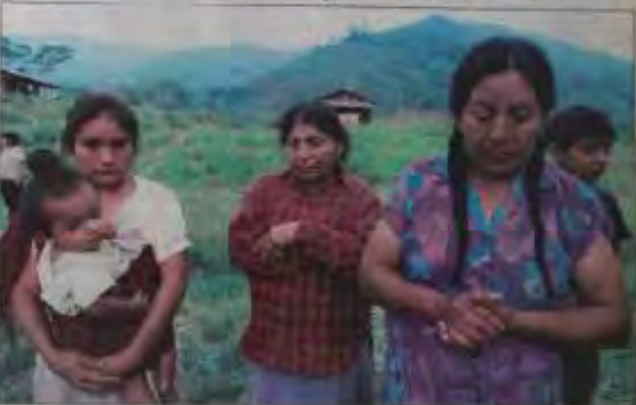
Los shuaras en las montañas de la zona de Cotacachi. Los shuaras exigen la liberación inmediata de los detenidos y la devolución de sus tierras.

Los garantes y los vicecaucilleres se reúnen a mediodía en el Itamaraty para discutir el caso de los shuaras. El secretario de Estado, César Lora, dijo que el gobierno peruano está trabajando para resolver el conflicto. Los vicecaucilleres, por su parte, exigen la liberación inmediata de los shuaras y la devolución de sus tierras. La reunión se prolongó hasta las 14 horas.