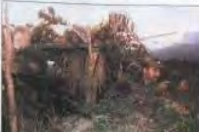
VALLAGUA, ECUADOR (Zona de la frontera con Perú). Un paisaje que muestra a las autoridades peruanas en un tradicional conflicto fronterizo.

Los acuerdos de Lima, entre el Ecuador y el Perú, han sido una realidad. Pero el Ecuador, al haberse comprometido a cesar las hostilidades, se encuentra en una situación que requiere de una nueva tesis para cese al fuego en el área de frontera con el Perú. En esta tesis, se propone un nuevo modelo de negociación que permita a las partes involucradas en el conflicto, un acercamiento a la paz y a la solución de sus problemas.