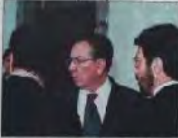
El ministro Raúl León tras el ingreso al Palacio de Gobierno.

El ministro de Relaciones Exteriores, Raúl León, propuso un alto al fuego en la zona de conflicto entre Ecuador y Perú.