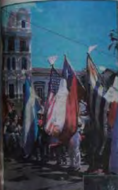
Estudiantes residentes en Chile repatriados al Ecuador, ante la agresión peruana.