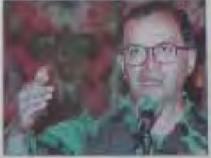
El ministro de Defensa, general de división Juan José Torres, durante un momento de su discurso en Quito.

En el frente diplomático, los generales promueven nueva propuesta que será entregada en los próximos días.