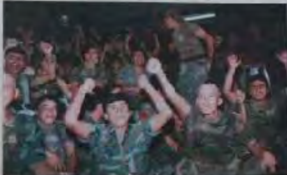
Soldados ecuatorianos miembros del FRENTE 62

El presidente brasileño, Collor, se reúne, antes de comenzar la jornada diplomática, con el secretario de Asuntos Exteriores, Celso Lafer, y con el ministro de Defensa, Carlos Tinoco. Los ministros de Defensa de Argentina, Brasil, Chile, Colombia, Ecuador, España, Francia, Alemania, Italia, México, Perú, Uruguay, Venezuela y Estados Unidos se reúnen hoy en Brasilia para iniciar la fase decisiva de las negociaciones.