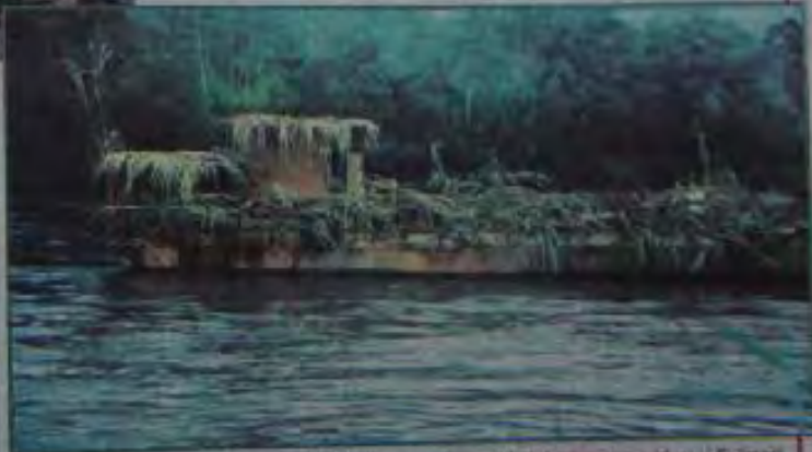
La sociedad sigue viviendo ante la infamia promovida por Fujimori

Intervención respecto a PE, AA. Página 11