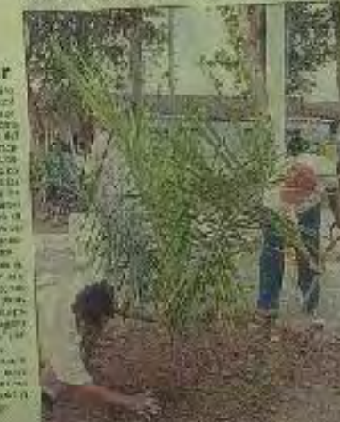
Ejemplo a ser imitado

QUITO. El gobierno ecuatoriano espera a la misión técnico-militar que llegará a Ecuador en los próximos días. El gobierno ecuatoriano ha expresado su preocupación por la situación y ha llamado a la calma y a la negociación pacífica.