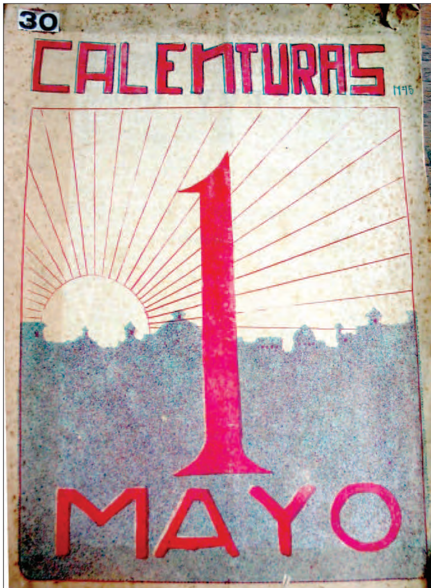
“Primero de Mayo” Revista Calenturas , 1923.