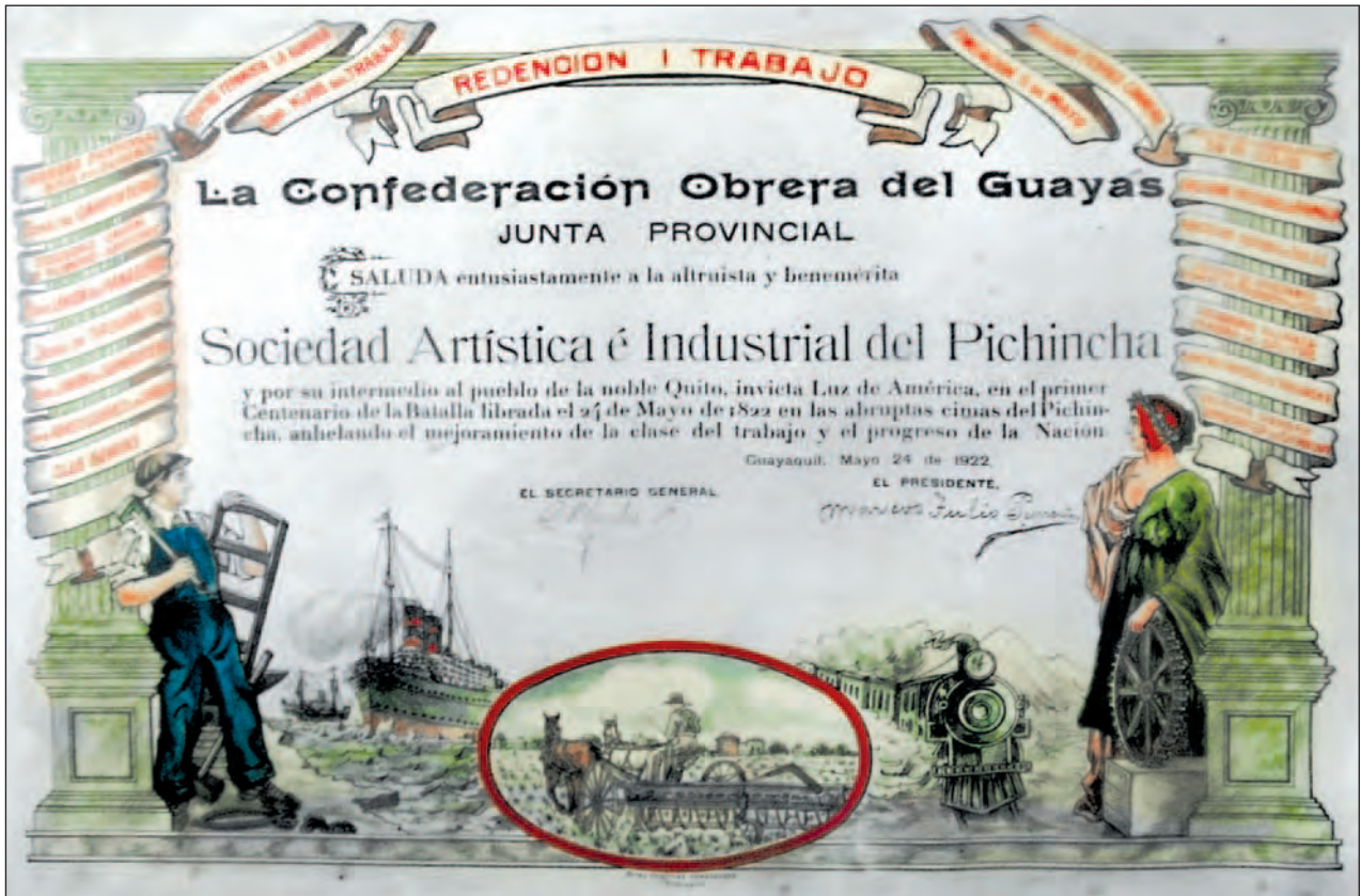
Pergamino de reconocimiento de la COG a la SAIP en la conmemoración del Centenario de la Independencia del Ecuador.