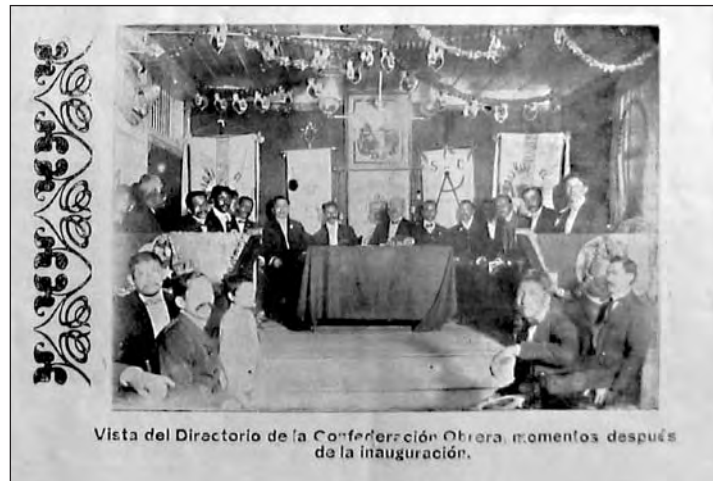
Vista del Directorio de la Confederación Obrera, momentos después de la inauguración.

Inauguración del salón de actos y biblioteca de la Confederación Obrera de Guayaquil (COG). Se observa en el salón simbología liberal y masónica. Revista Instantáneas, N° 2. Guayaquil, marzo 1908.