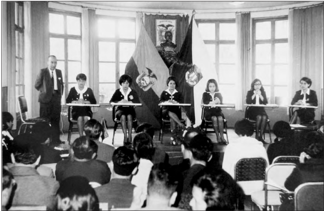
Debates estudiantiles. Biblioteca Colegio Manuela Cañizares.