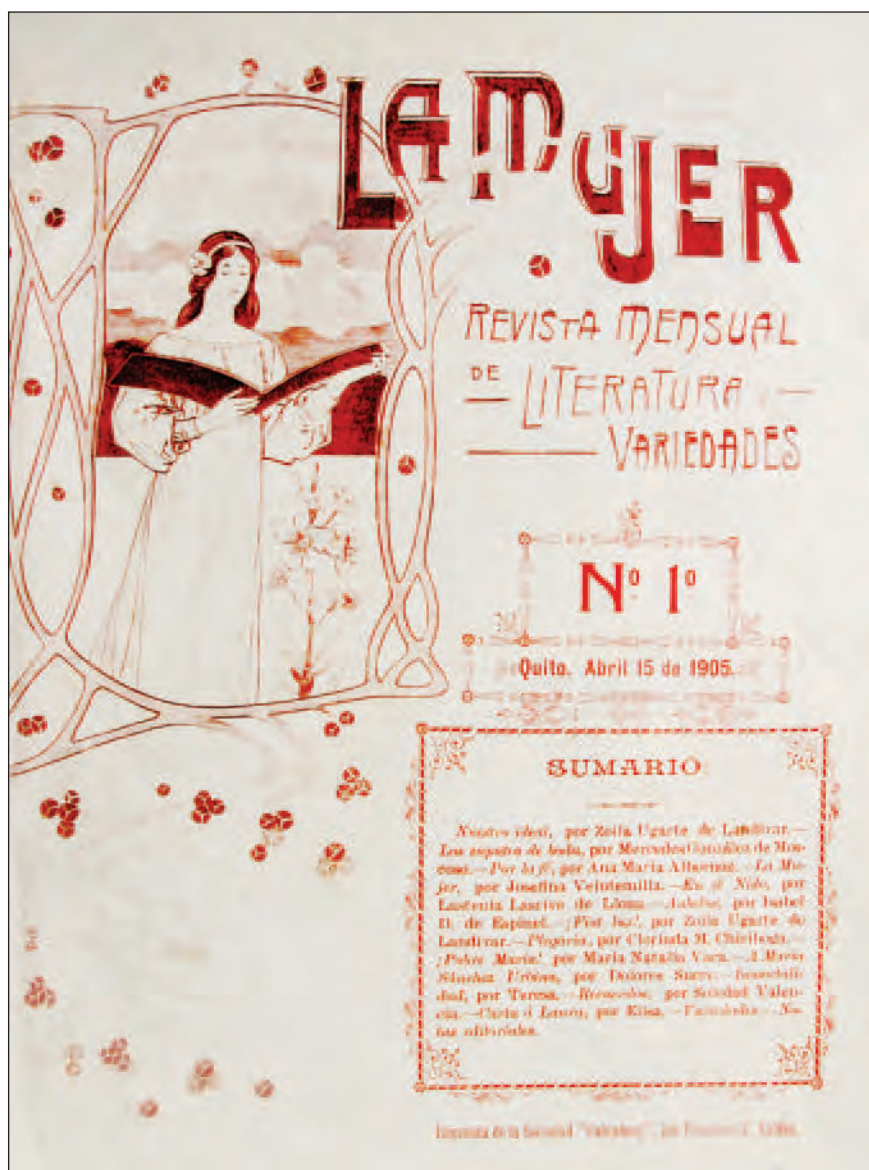
Portada revista La Mujer , Nº 1. Quito, abril 1905. Lit. Academia de Bellas Artes. Biblioteca Ecuatoriana Aurelio Espinosa Pólit.