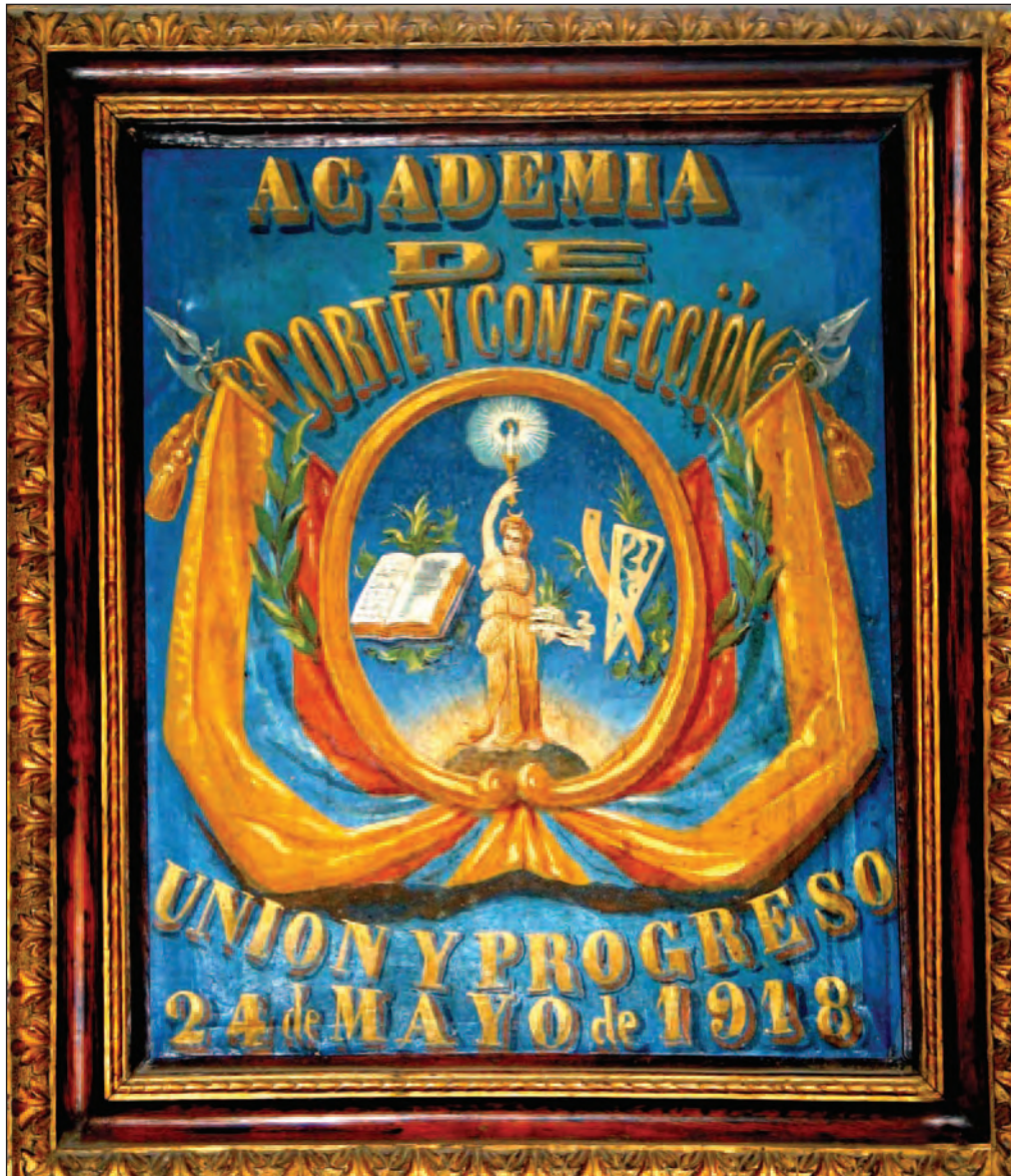
Blasón del gremio de la Academia de Corte y Confección que formaba parte de la Sociedad Artística e Industrial de Pichinch (SAIP), preparados para los festejos del Primer Centenarios de la Independencia, 1909-1930.