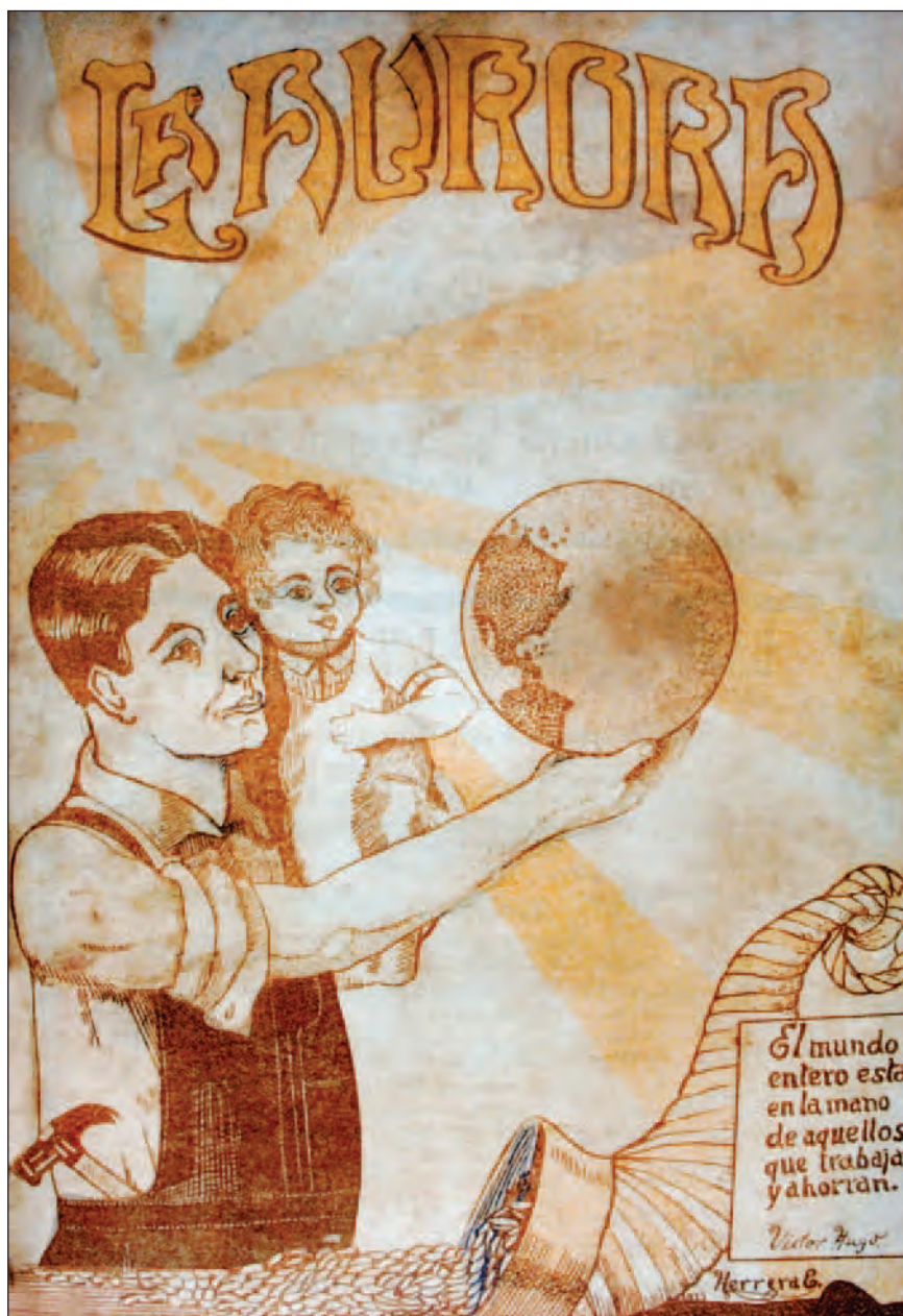
Portada revista La Aurora , N° 109. Guayaquil, septiembre 1927. Dibujo de Herrera.