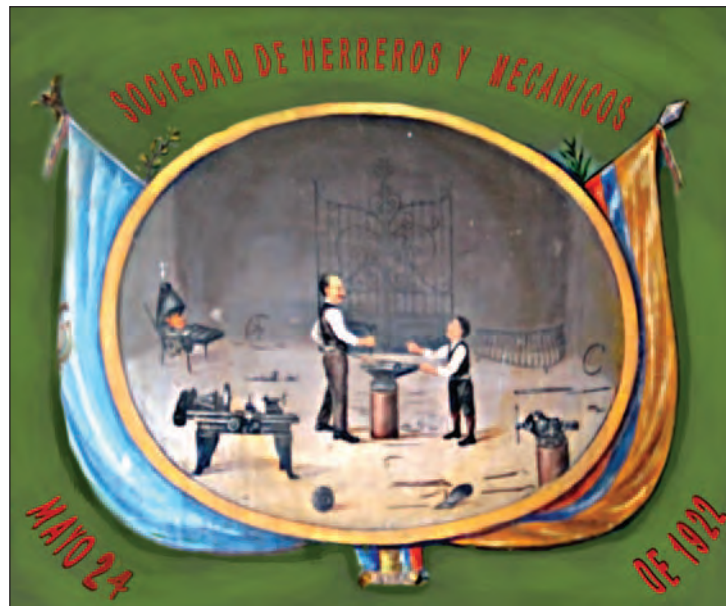
Blasones de los gremios de la Sociedad de Joyeros y de la Sociedad de Herreros y Mecánicos que formaban parte de la Sociedad Artística e Industrial de Pichinch (SAIP), preparados para los festejos del Primer Centenario de la Independencia, 1909-1930.