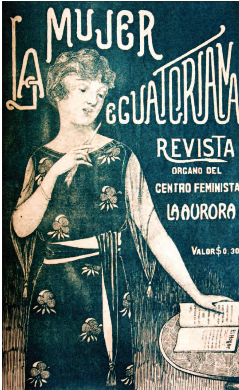
Portada revista La Mujer Ecuatoriana , N° 23. Guayaquil, marzo 1921. Biblioteca de autores ecuatorianos Carlos A. Rolando, Guayaquil.