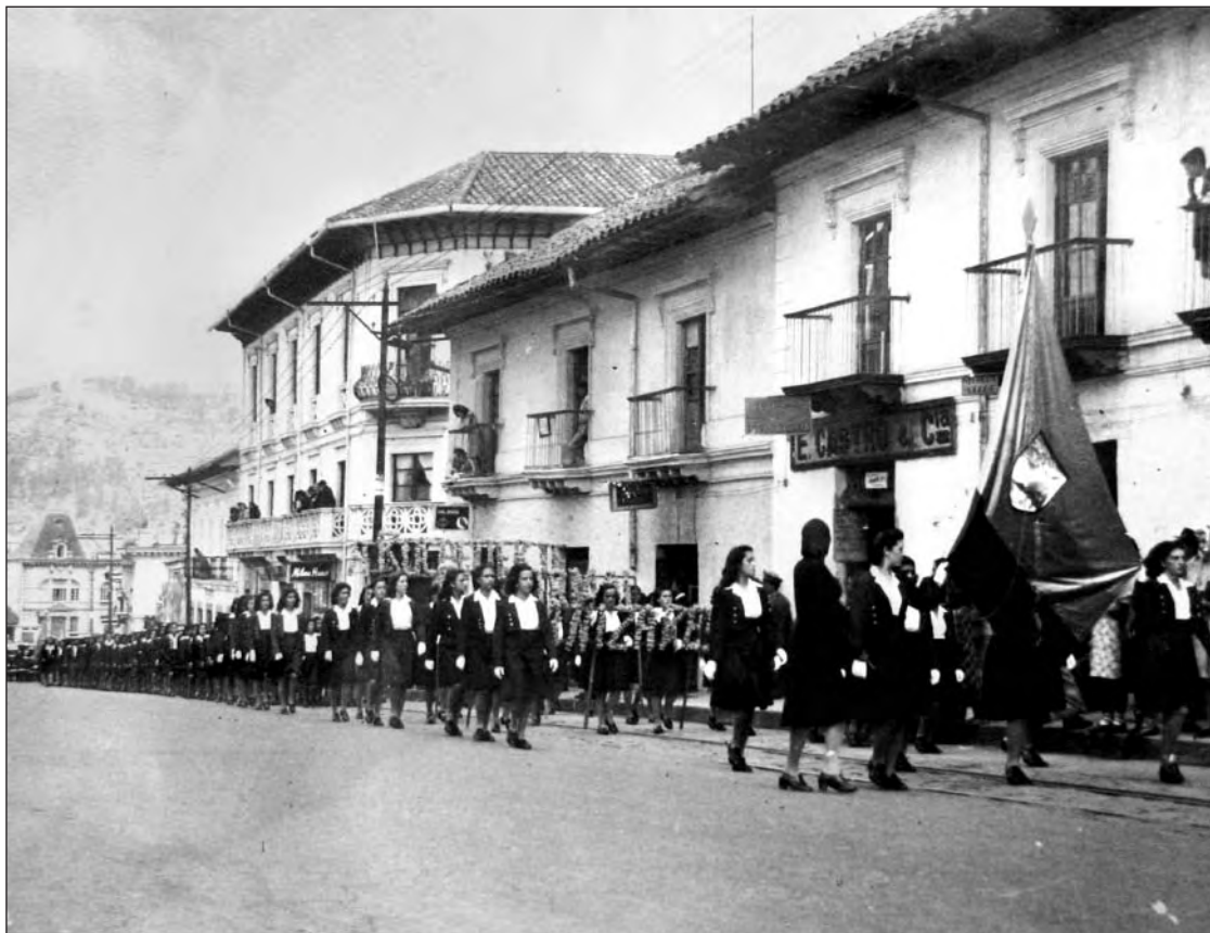
Desfile de colegios femeninos. Biblioteca Colegio Manuela Cañizares.