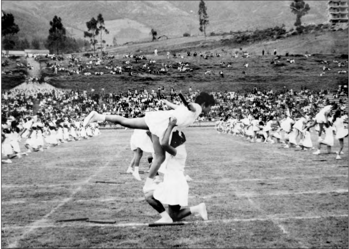
Prácticas de gimnasia escolar. Biblioteca Colegio Manuela Cañizares.