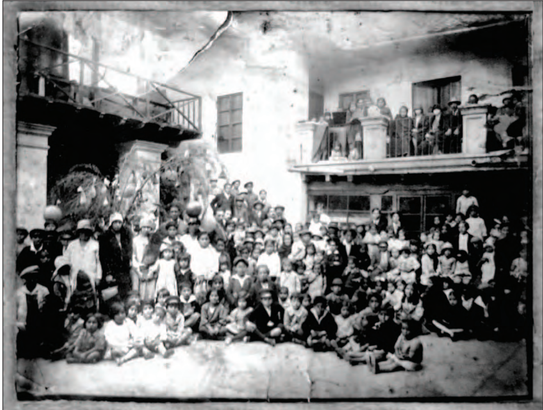
Obreros y sus familias en la Fiesta de Navidad organizada por la Sociedad Artística e Industrial (SAIP). Quito, c.a. 1919.