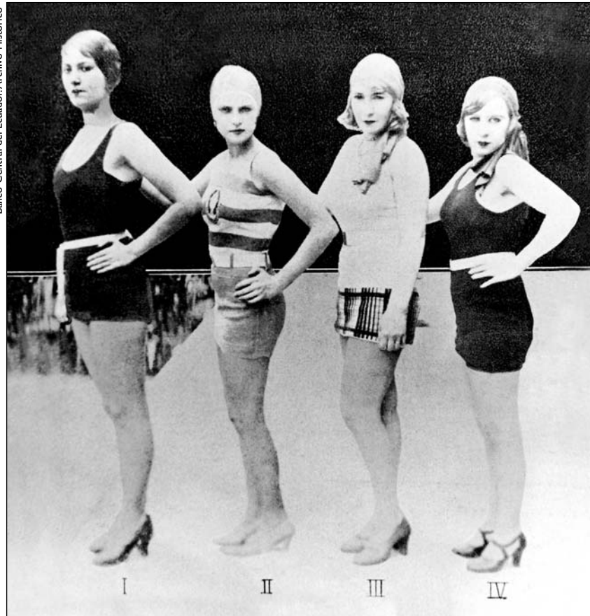
Elección de Miss Ecuador 1930

en común que hacen referencia a una visión estereotipada de lo que constituye “ser mujer”. Desde este punto de vista no importa tanto ser una hermosa Miss , una mujer inteligente o una virtuosa madre. Lo realmente importante es el uso y la connotación que tenga para las propias mujeres. Porque estas concepciones pueden aludir igualmente a roles prefijados de antemano por alguien o algo (el mercado, la moral o el intelecto) cuyo poder de decisión esté por fuera de las mujeres. En este sentido, ¿no sería más interesante para todos, como muchas han empezado a hacerlo y como han defendido algunas corrientes feministas, que las mujeres decidamos sobre nuestra propia imagen y nos convirtamos de manera flexible y cambiante en lo que queramos ser?