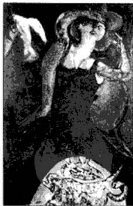
Portada: La Virgen de Quito Cuadro: Ramiro Jácome