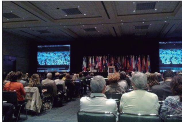
Convención Anual de Bienes Raíces, Orlando, EE.UU. http://www.inmobiliariasalcora.com/AdministracionNoticias/mostrarNoticia.php?codigo_noticia=29