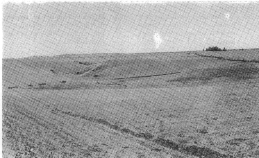
Figura 1. Terrazas formadas luego del retroceso de los glaciares. Región de la Merced, Tixan. Sierra Central del Ecuador, Provincia Chimborazo.