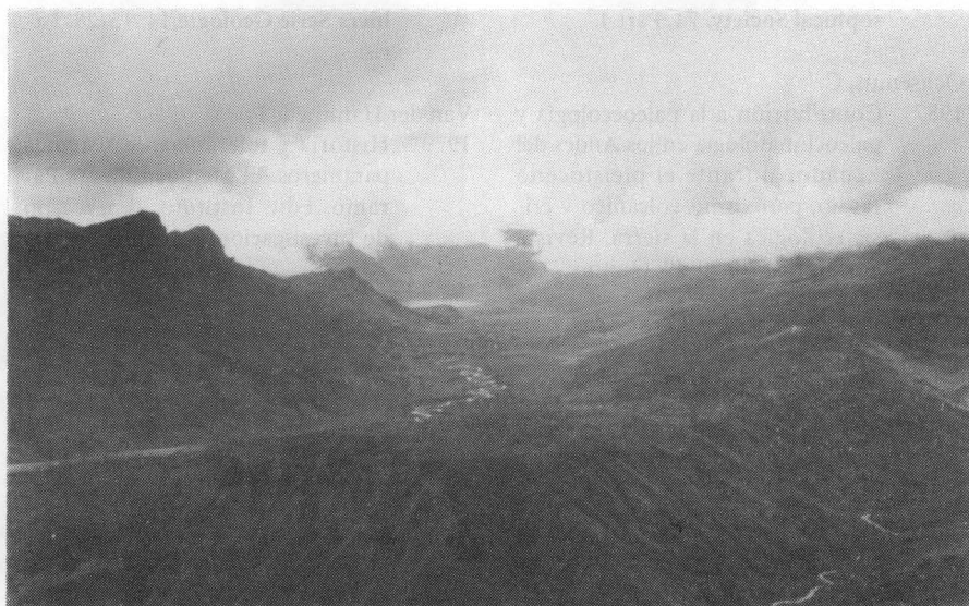
Figura 2: Valle glacial de Atillo, con río anastomozado y lagos en rosario. Sierra Central del Ecuador, Provincia Chimborazo.