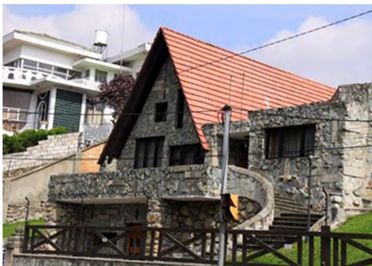
Figura 5: Casa expresión de la denominada arquitectura cuencana