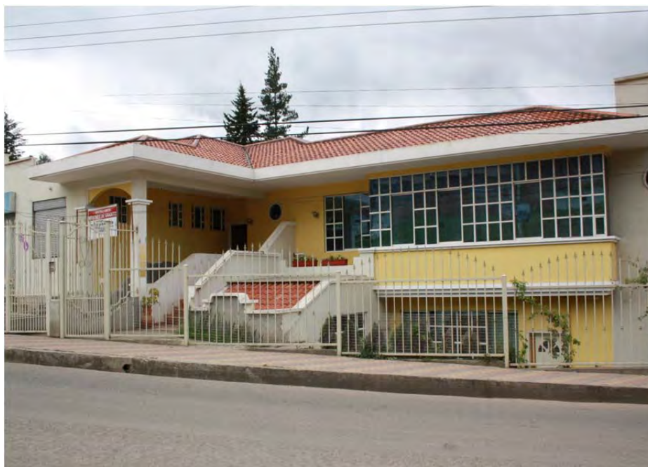
Figura 21: Casa de migrante, sector Huizhil, parroquia Baños

No, no es de mal gusto porque verá, yo le digo que yo tengo un gusto, y el dueño tiene otro gusto, no vamos a igualar los gustos. Como el arquitecto tiene un gusto y yo tengo otro gusto, a él le va a parecer feo lo que yo hago, ¿no es cierto? como mi casa. A mi si no me gusta la casa del arquitecto, digo “eso más feísimo, no debía hacer así”. Entonces con los gustos no tenemos todos igual, entonces no es que son feas, toda construcción son chéveres para cada dueño, ¿no cierto? Eso yo pienso en mi pensamiento, no es que una casa es fea, sino que al dueño le gusta así, tiene que ser así (Entrevista maestro de obra, junio de 2011).