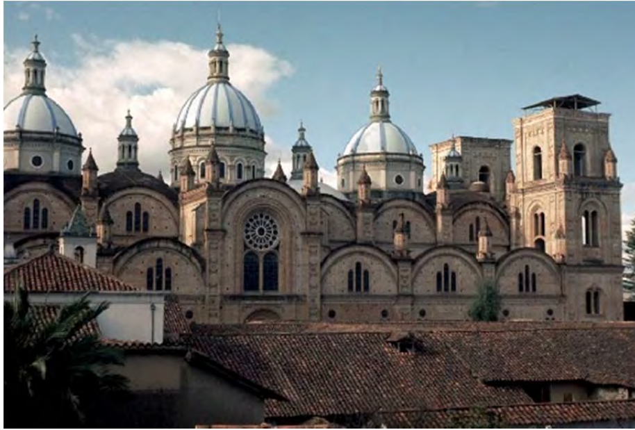
Figura 8: Catedral “Nueva” de Cuenca.