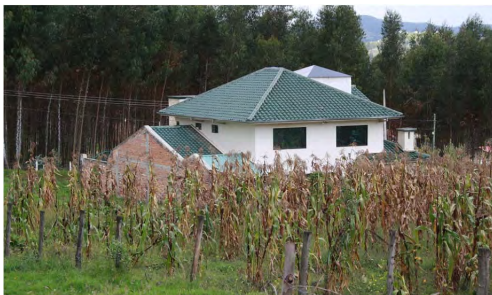
Figura 18: Casa de migrantes, sector Huizhil, parroquia Baños

sectores acomodados expresan su “buen gusto” en arquitectura y sus maneras sofisticadas. El aspecto rústico de la “arquitectura cuencana” se relaciona más con el apego hacia el entorno natural antes que con su vertiente vernácula, porque de lo que se trata precisamente es de distinguirse de lo popular, que es visto como una arquitectura humilde. Pero frente a esta corriente del mainstream se opone la “arquitectura de los migrantes”, del underground , que desafía visual y simbólicamente la hegemonía de la primera. Por tanto la “arquitectura de los migrantes” la ubica Klaufus dentro de la vertiente de la arquitectura vernácula o popular, sobre todo por ser resultado de un autodesarrollo, antes que por los materiales empleados, puesto que no usa materiales tradicionales.