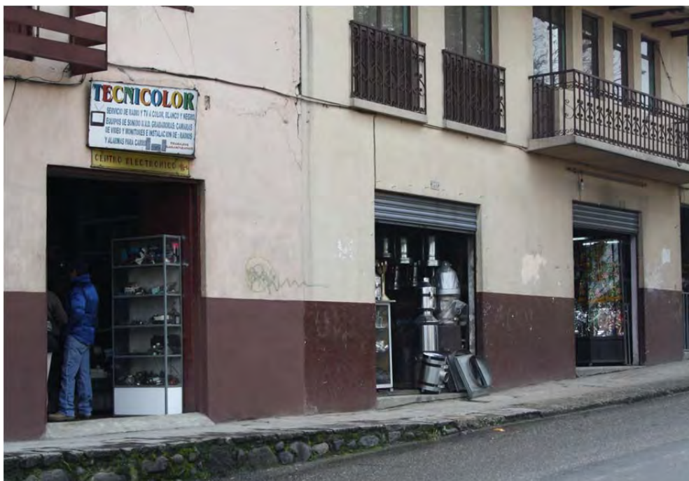
Figura 11: Tiendas de artesanos de la subida del Vado

Este negocio no cambió para nada. El barrio todo está cambiando, volviendo a como era más antes, más antes. Se ve más bonito lo que están haciendo. Pero el negocio no cambio (Entrevista barbero, junio de 2011).