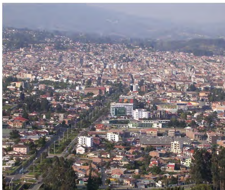
Figura 25: Vista parcial de la ciudad de Cuenca