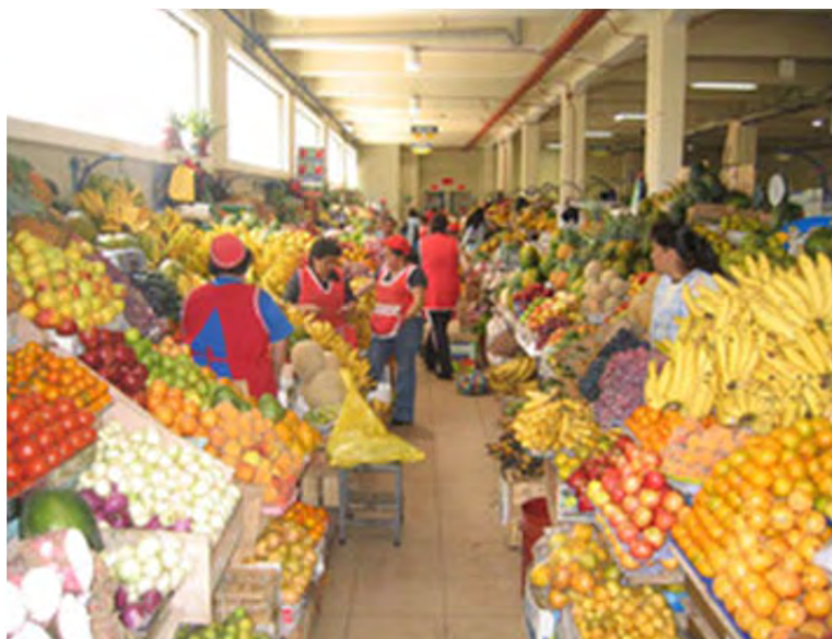
Figura 33: Puestos de venta de fruta en el Mercado 10 de agosto

Con la remodelación de los mercados se insertaba a la ciudad y su región de influencia en una modernidad, superando sus rezagos tradicionales, puesto que estos espacios se habían constituido en verdaderos enclaves de premodernidad, con su desorden, falta de higiene, violencia. Pero también los mercados han sido el locus de la raza atravesado con el género, porque ahí es donde se encuentran las mujeres cholos comerciantes , una explosiva intersección de género, raza y clase que convierte a estos sitios en micro mundos que funcionan como verdaderos laboratorios sociales. Cuando hablamos de raza nos referimos a este concepto como una construcción social, como un juego de ideas acerca de los humanos, las cuales pueden tener muy poderosas consecuencias tales como discriminación y violencia racial (Wade, 2008). Esto es diferente del denominado “racismo científico”, según el cual los científicos desarrollaron la idea de la raza como la principal categoría biológica para entender la variación física humana y el comportamiento, lo cual legitimaba las jerarquías raciales. Durante el siglo XX, el racismo científico fue paulatinamente desmantelado. En este contexto mi planteamiento es que la raza es un tema pendiente en la construcción hegemónica en Cuenca, un punto de sutura que no está cerrado y que ha generado, aún dentro del proyecto político de la Nueva Ciudad, feroces luchas que se mantienen aún abiertas.