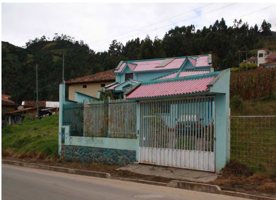
Figura 17: Casa de migrante, sector Huizhil, parroquia Baños

En los lugares más remotos de la provincia, usted ve edificaciones a imagen y semejanza de...pero ni siquiera es eso, no sé porqué, simplemente son edificios de muy mal gusto, que usan vidrios de colores, de colores estridentes, [...] desde el avión es muy dramático ver esto en el paisaje rural. Son formas yo creo de expresar identidad, yo diría hasta algo de poder de la gente que ha migrado, de mostrar una cierta reivindicación social que no es la más apropiada, yo le entiendo de esa manera. Pero quisiera que fuera de otra forma, algo más integrado al paisaje, a la cultura local nuestra. (Entrevista gestor cultural 1, abril de 2009).