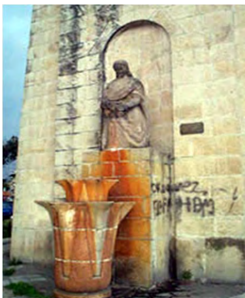
Figura 31: Monumento a la Chola Cuencana, antes de su restauración

cuencanas, fuertemente asentados en un ideal hispánico de los fundadores de la ciudad, con una tímida presencia de la chola cuencana. Pero de este modo, se produce un mensaje contradictorio, a la vez que se realza la presencia de la chola ubicándola de frente para dar la bienvenida a los visitantes de la ciudad; se separa a la figura petrificada de la chola del poder, expresado en el virrey. Esta política de reconocimiento que expresa aparentemente una afirmación de la identidad, podría ser interpretada paralelamente como una depreciación de su potencialidad política. En esta tensión no resuelta se mueve el proyecto hegemónico de la Nueva Ciudad, en su relación con los sectores subalternos, como lo vamos a examinar en este capítulo.