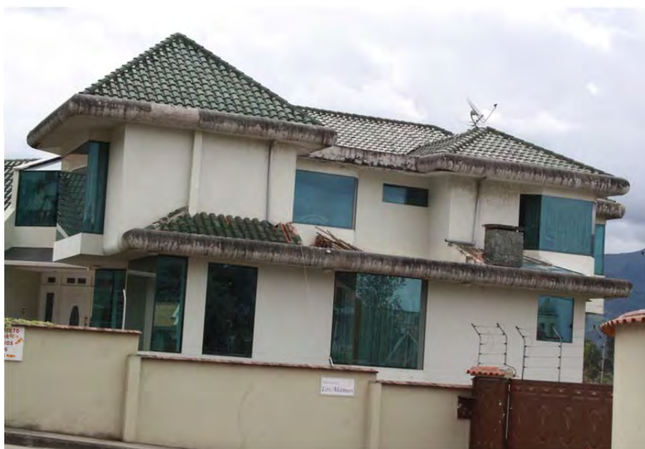
Figura 23: Casa de migrante, sector Huizhil, parroquia Baños

A otras personas consultadas no les preocupa mayormente el tema de la estética de las casas y como ellas son estigmatizadas por los cuencanos que viven en la ciudad. Lo más importante para estas personas es el hecho de tener un techo digno donde vivir, y poder ahí reunir a su familia: