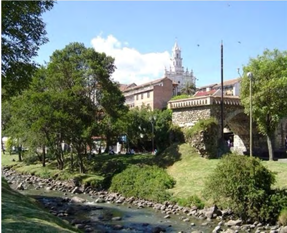
Figura 7: El Barranco, sector Puente Roto

El expediente recoge, de forma penetrante y con un lenguaje experto, aquello que circula en esta comunidad, y es precisamente el imaginario que permite encontrar consenso y hasta unanimidad en la iniciativa Cuenca Patrimonio, y es por lo mismo el elemento central que me permite argumentar que el patrimonio se convirtió en un dispositivo excepcional e inigualable para el nuevo proyecto hegemónico: