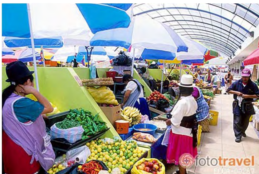
Figura 32: Interior del Mercado 10 de agosto

El modelo de cogestión y co-propiedad que se planteaba el alcalde no llegó a concretarse, debido a que su alcaldía terminó meses después y esta decisión fue revisada por la siguiente administración. Pero ¿qué implicaciones tuvo este nuevo modelo de propiedad planteado por el “corcho”? Podemos advertir que hay un conflicto entre privatizar el espacio público del mercado pero a la vez empoderar a las vendedoras como propietarias. El discurso de ser copropietarias las dirigentes lo acogieron inmediatamente: “No es un mercado, es una empresa, somos condueñas y por eso debemos cuidarlo y porque nos cuesta” 90 .