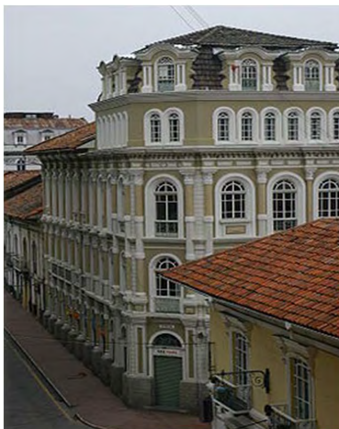
Figura 9: Edificio Republicano en el Centro Histórico de Cuenca

El argumento del centralismo quiteño trasluce nítidamente en las representaciones de la prensa cuencana en esos días. Se menciona en noticias de prensa y en editoriales que la iniciativa para la declaratoria de patrimonio de Cuenca fue un esfuerzo propio y que las instancias pertinentes centralizadas en la capital no hicieron nada para ayudar a la ciudad en este empeño, pero que además pretendieron aprovecharse del momento: