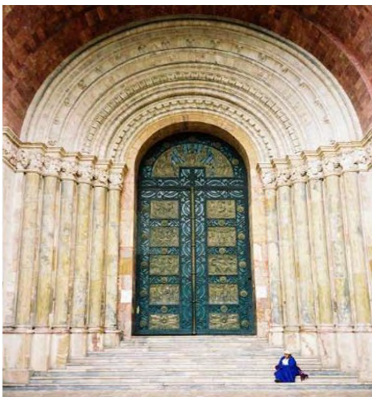
Figura 29: Detalle de la Catedral de Cuenca