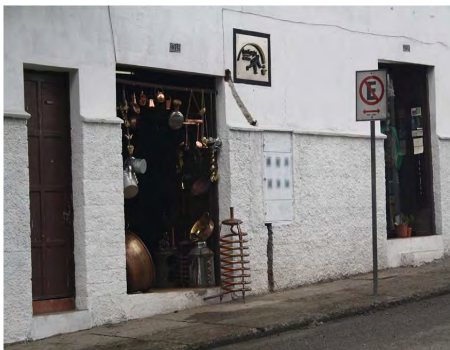
Figura 12: Tienda de artesanías de cobre y hojalatería

El Cidap (Centro Interamericano de Artesanías y Artes Populares) para que tenga una idea de lo absurdo que es, alguna vez me fui a golpear la puerta y me dijeron que mi trabajo era chusco, y como me ven que yo fui evolucionando me han mandado a invitar un montón de veces, pero yo no voy. Para aprovecharse de las personas primero hay que apoyarles ...tampoco soy ignorante, gracias a dios, a la universidad hasta segundo año estuve. Se creen dueños de la verdad, el arte está secuestrado por un número de personas que se creen dueños de la verdad (Entrevista hojalatero, junio de 2011).