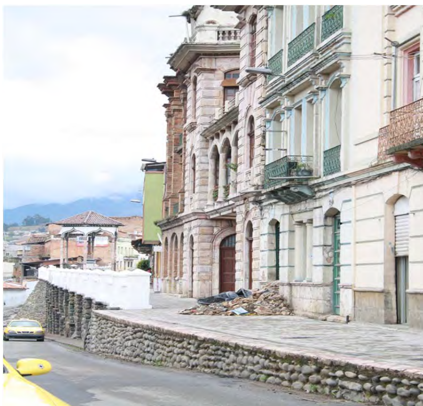
Figura 13: La subida del Vado, arquitectura republicana

Los dos alcaldes anteriores han sido excelentes, porque a raíz de Cordero la ciudad tuvo un cambio importante. En realidad este alcalde no está haciendo, está concluyendo. Quien innovó fue el arquitecto Fernando Cordero (...) el arquitecto Cordero era una persona con visión, el trató de sembrar. (Con la declaratoria) si ha aumentado el turismo, pero a nosotros como artesanos (no nos ha beneficiado) al menos yo, no mucho. La gran mayoría viene, se toman fotos, pero es raro que compren, yo vivo más de las cosas utilitarias. Lo que es hoteles, restaurantes ha ayudado, y si hay turismo también (Entrevista hojalatero, junio de 2011).