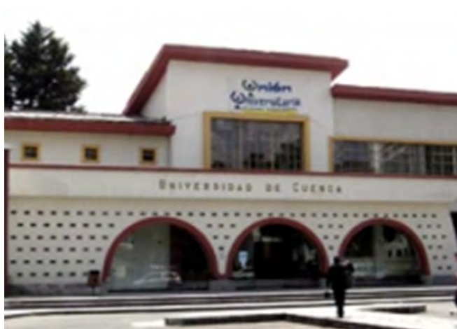
Figura 27: Universidad de Cuenca Fotografía:

En estos análisis de la realidad regional se describen los principales problemas que enfrenta la región, las oportunidades y fortalezas que posee, y se trata de delinear efectivamente una visión estratégica de la ciudad y la región, aquello que ACUDIR se había planteado. Es decir, fueron los académicos universitarios uno de los puntales para este diseño estratégico de la región, aunque esta propuesta no fue completamente sistemática, ni tuvo toda la receptividad en los actores que integraban la junta directiva de la agencia de desarrollo.