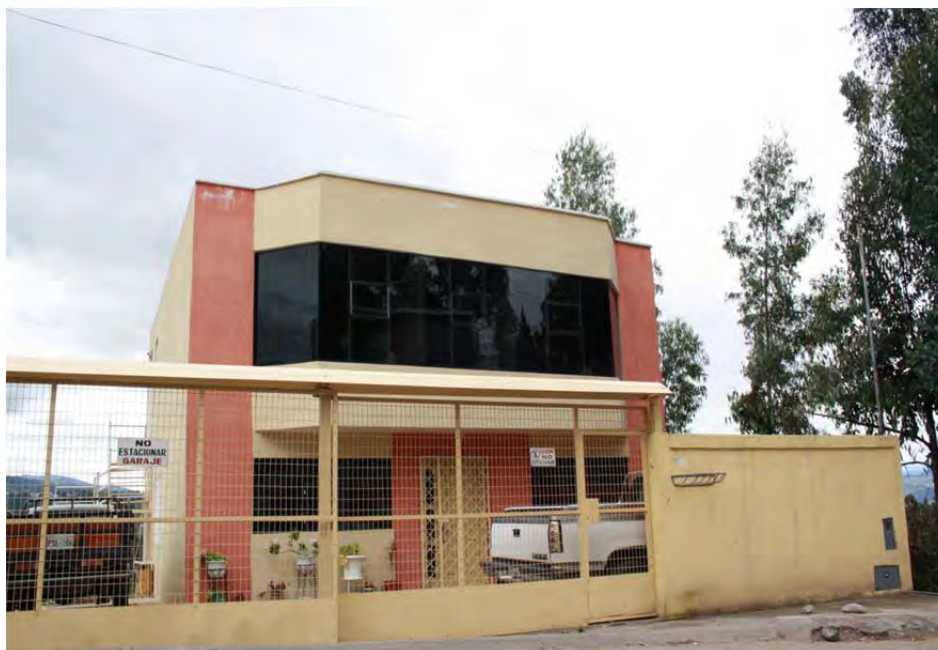
Figura 20: Casa de migrante, sector Huizhil, parroquia Baños

escenario arquitectónico y que un proceso tan profundo como el experimentado en la región sur no puede ser ocultado, invisibilizado o estigmatizado.