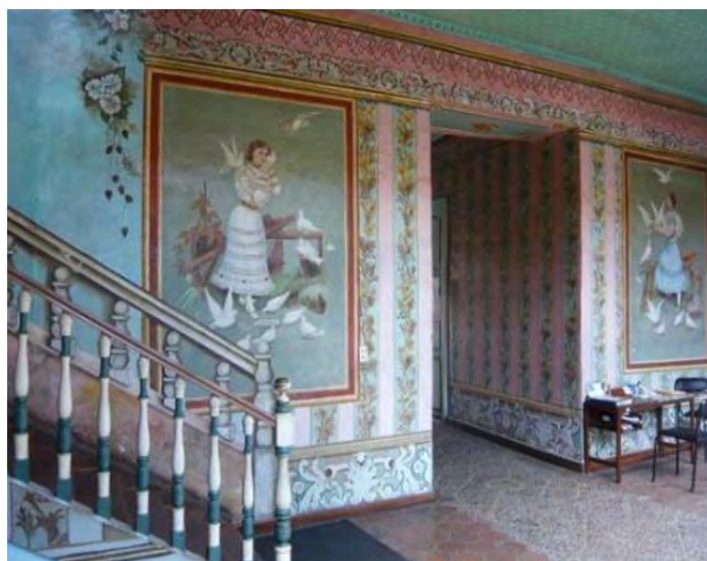
Figura 3: Casa de las Palomas

Desde una perspectiva local y autocomplaciente, se ha querido ver una especificidad de Cuenca y su región en un carácter especial que han desarrollado sus elites que se diferencian de las de Quito y Guayaquil. Portadoras de un tradicionalismo urbanizado, o de una especial condición civilista en donde el apego a la ley y religión constituían sus premisas (Cárdenas, 2004), estaban asentadas en un patriciado de raíz colonial, todo lo cual devino en la formación de un buen gestor político con un alto nivel educativo. Ha sido destacado el apego de las elites cuencanas por la cultura, las letras, y en general la contribución intelectual que ha dado Cuenca al país (Malo, 1993). Pero del otro lado, desde una perspectiva crítica, se ha puesto énfasis en el carácter de dominación aristocrática que han ejercido estos grupos en el sentido de que han controlado muchas instituciones y sus recursos. Las elites de Cuenca han desplegado una serie de estrategias para mantener su poder: desde una auto-identificación con una supuesta nobleza aristocrática hasta el control de los recursos económicos, pasando por el control político y de una serie de instituciones (Brownrigg, 1972, Hirschkind, 1980). Se han mencionado como características del espíritu de las elites cuencanas los valores religiosos, su amor por la poesía bucólica y los símbolos mariales, pero unidos a otros valores como el individualismo, la xenofobia, la astucia, la honradez, el ascetismo, la murmuración (Cordero et al., 1989).