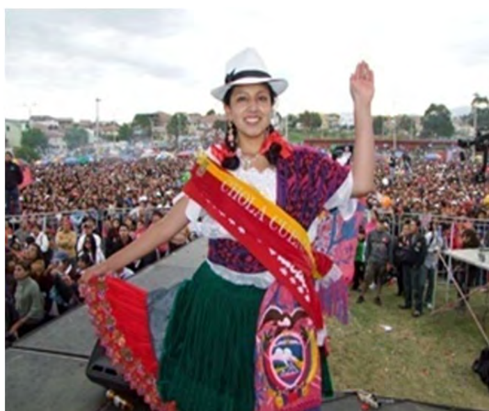
Figura 36: Chola cuencana 2010, luciendo un chal con la figura bordada del Escudo Nacional Fotografía: El Mercurio, 4 de noviembre de 2010.

En relación al paño, el historiador del arte se refiere al “abundante filamento en los extremos”. A pesar de que la producción artesanal de paños de macana elaborados en telares manuales en el cantón Gualaceo de la provincia del Azuay continúa en la región con algunas dificultades, las cholitas en el concurso usan los paños tradicionales, los cuales tienen, en efecto, un largo fleco anudado de variadas formas, y sobre el mismo un bordado del escudo nacional. El uso del escudo del Ecuador en el paño de macana de las cholitas en general, y de las concursantes a la elección de chola en particular, es un signo expresado perceptiblemente en el vestuario, de que la chola enuncia la identidad regional pero articulada al imaginario de la identidad nacional. En el siglo XIX, como vimos en el capítulo que analiza el tránsito del proyecto Cuenca Atenas a Cuenca Patrimonio, los proyectos autonomistas de la región austral quedaron en alguna medida superados, y se fue consolidando una identidad nacional, aunque con fuertes particularidades que se mantienen en la región austral.