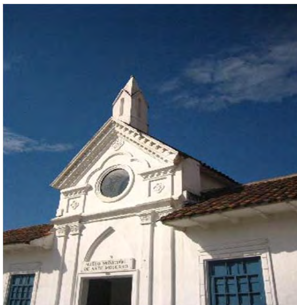
Figura 6: Museo de Arte Moderno

habría determinado que habían dos sitios en el país con potencialidad para ser incorporados en la lista de Patrimonio Mundial, Zaruma y Cuenca (Entrevista funcionario diplomacia, junio de 2009).