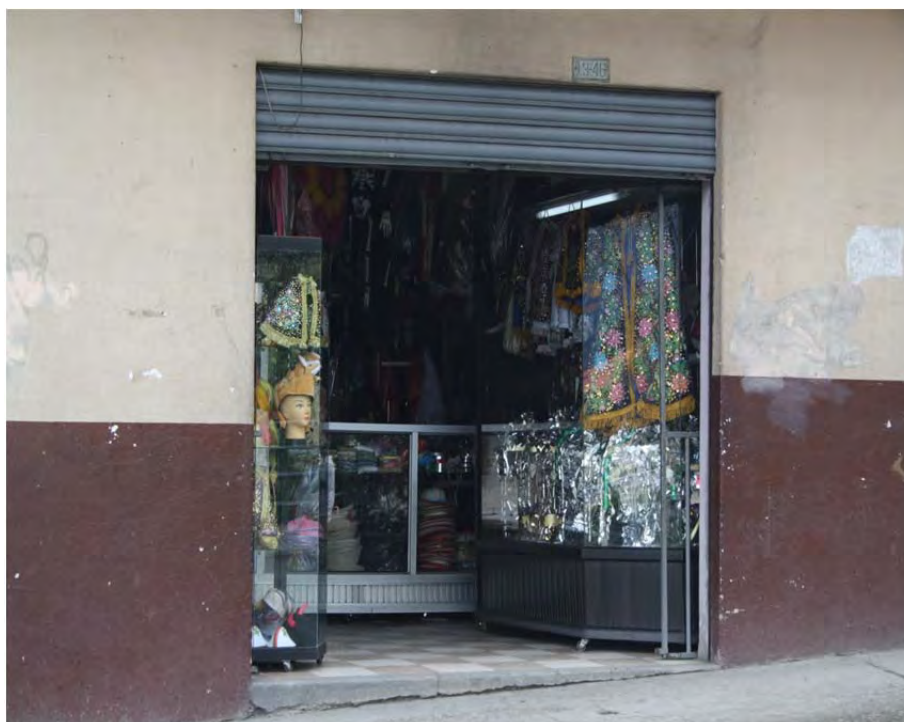
Figura 14: Tienda de confección y alquiler de trajes

(La declaratoria) fue buena porque realmente Cuenca necesitaba eso mismo, para el turismo y todo eso, esta parte ahorita mismo es turismo (Entrevista radiotécnico, junio de 2011).