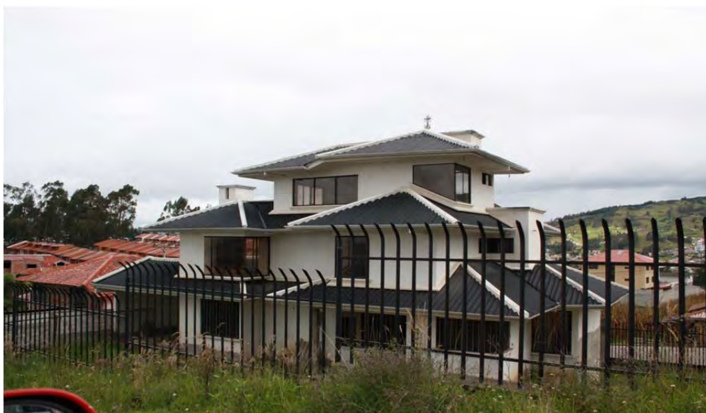
Figura 19: Casa de migrante, sector Huizhil, parroquia Baños

Esto ha traído un cambio en la arquitectura suburbana, en donde las casas por correspondencia, o “villezas”, más que proponer soluciones norteamericanas, españolas o italianas, proponen formas híbridas o kitsch, en las cuales se exalta los materiales industriales en composiciones arbitrarias y caprichosas, porque, la variedad volumétrica y espacial que incorporan, no es tanto el resultado de una asimilación creativa de la arquitectura moderna, cuanto una digestión difícil y apresurada de la misma. Han aparecido entonces obras caras que por una parte usan columnas salomónicas made in Chuquipata, junto a carpinterías de aluminios con vidrios curvos, espejeantes, negros o de colores iridiscentes. Puertas de madera talladas y lacadas, pisos de porcelanato, griferías doradas, tejas industriales de mil colores. Estucos con florituras barrocas, muebles minimalistas sobre pisos flotantes. Casas sin agua potable, pero con jacuzzis... Es decir, construcciones de gustos no cultivados, casas de nuevos ricos, algunas muy costosas, pero que nada tienen que ver con obras de calidad arquitectónica y no digamos, con las obras de esa arquitectura patrimonial que de alguna manera habría establecido un estilo acorde a otra manera de vivir (Páez, 2008: 71).