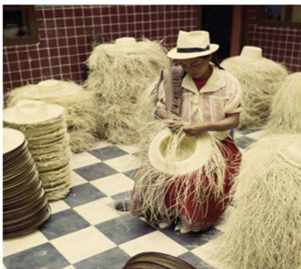
Figura 2: Tejedora de sombrero de paja toquilla

En el siglo XIX dos nuevos productos hacen que la región se incorpore a los mercados internacionales: primero la recolección de cascarilla que produce la quinina para curar el paludismo; posteriormente, la elaboración del sombrero de la paja toquilla que se comercializa en los mercados mundiales. La confección del sombrero encuentra en los artesanos de la comarca un nicho excepcional debido a la gran habilidad desarrollada por los campesinos azuayos en diferentes artesanías. A partir de estas ventajas se inicia un inusitado proceso de vinculación a los circuitos mundiales de comercialización y en consecuencia el surgimiento de una intrincada red de relaciones de producción y al mando de ellas una burguesía comercial exportadora, esto significó el surgimiento de “nuevos ricos” en Cuenca. Los mayores ingresos por la exportación del sombrero se los tuvo en la década de los cuarenta del siglo XX. Esto provocó una relativa rivalidad entre la elite agraria y los nuevos comerciantes que se disputaban la fuerza de trabajo (Brownrigg, 1972; Cordero, 1989).