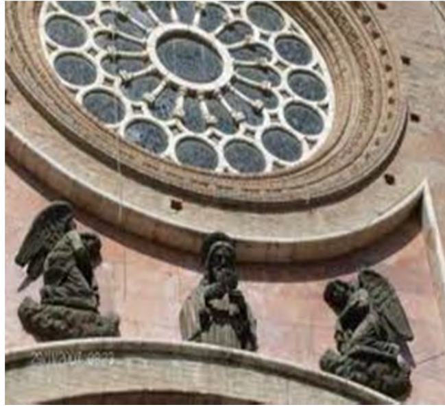
Figura 30: Detalle de la Catedral de Cuenca