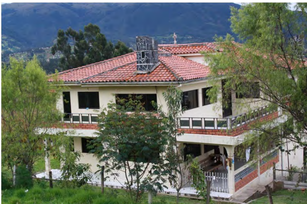
Figura 22: Casa de migrante, sector Huizhil, parroquia Baños

La contienda en el ámbito simbólico y arquitectónico se encuentra perfectamente instalada en la ciudad patrimonio de la humanidad y su entorno. Pero detrás de estos símbolos hasta cierto punto ideales, se encuentran intereses más terrenales como el control de los mercados profesionales, como lo advierte de forma penetrante Klaufus (2005). Pero las divergencias no son sólo entre los arquitectos posicionados y los arquitectos que construyen para los migrantes como este autor lo ha reconocido, sino también entre los arquitectos y los maestros de obras, como de forma transparente me lo comentó el maestro de Huizhil: