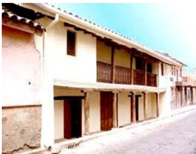
Figura 10: Casa colonial

Si bien la identidad barrial asociada a los diferentes oficios artesanales, es rescatada en este documento y en innumerables publicaciones de la imaginaria morlaca, no es menos cierto que tiende a presentarse a ésta como un síntoma de consentimiento y aprobación de los artesanos y sectores populares. Los artesanos en el siglo XIX y en el XX, generalmente fueron convocados por la “nobleza” conservadora cuencana para diferentes luchas políticas (Crespo, 1996).