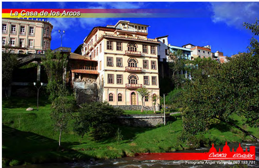
Figura 16: Casa de los Arcos en el Barranco del río Tomebamba

En la presentación de un extracto de este estudio, que la hace Hernán Crespo Toral, asocia el tema del patrimonio con la nación, puesto que el “atentar contra el patrimonio implica desvirtuar el viejo espíritu de la nación” (Consulcentro, 1985: 3) Esta referencia resulta muy interesante aunque paradójica para algunos cuencanos. La construcción de la nación ecuatoriana, ha implicado procesos de exclusión regional porque ha estado frecuentemente asociada al centralismo del Estado, posicionado en el centro de la nación, Quito. La patrimonialidad de Cuenca, de todas formas venía a abonar a la edificación de este “viejo espíritu de la nación”, sin embargo, primero abonaba a la construcción de la cuencanidad.