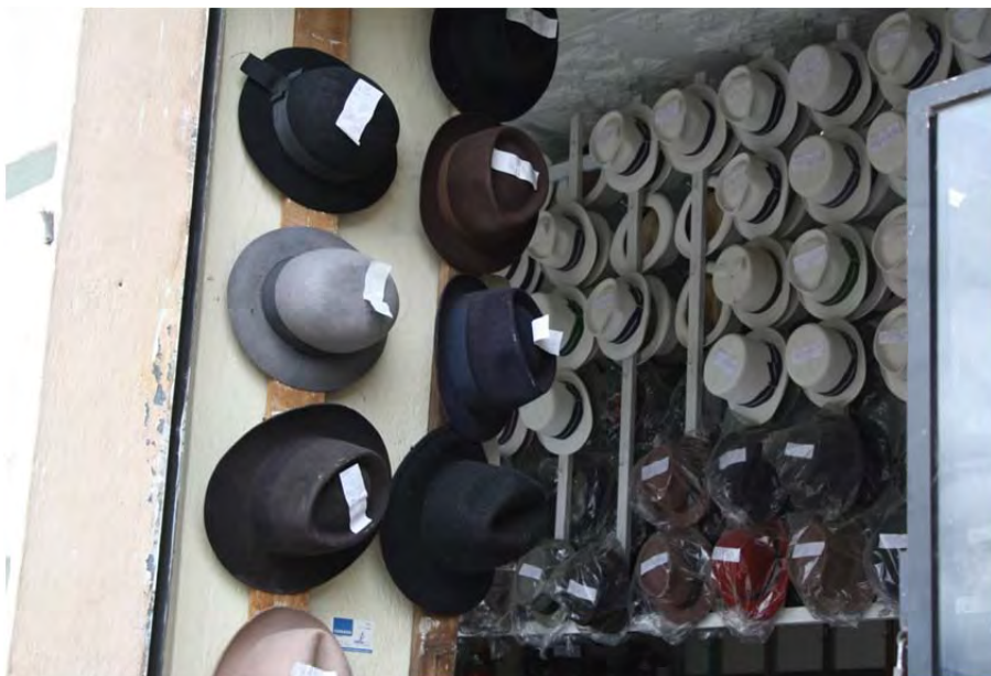
Figura 12: Tienda de reparación de sombreros

son cosas valiosas, pero no tienen sentido (Entrevista sombrero, junio de 2011).