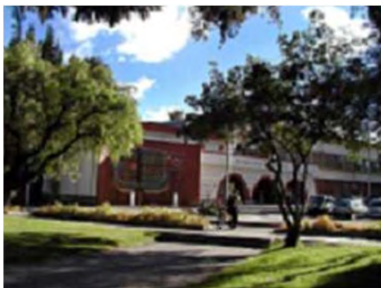
Figura 28: Universidad de Cuenca