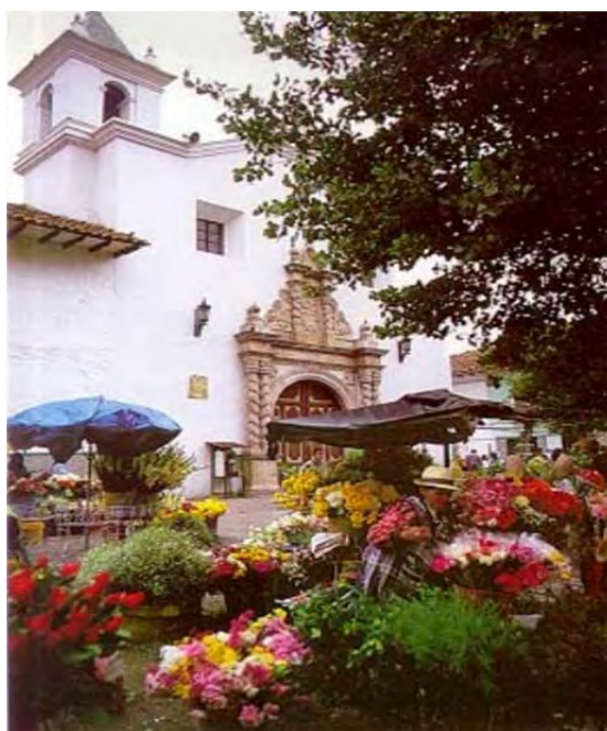
Figura 1: Iglesia de El Carmen y Plaza de las Flores Fotografía: http://www.tripadvisor.es/LocationPhotos-g294309-Cuenca.html .

Podemos indagar los diferentes momentos de la arquitectura de Cuenca en los estilos estéticos vigentes en el momento, pero también se pueden rastrear en los ciclos económicos de auge y crisis que ha tenido la economía regional del austro (Cordero Cueva, 1989). En la etapa colonial se suceden varios ciclos económicos: la explotación minera, luego la actividad agrícola y posteriormente la industria textil.