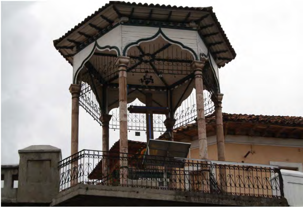
Figura 15: La Cruz del Vado

Desde una perspectiva más amplia los gestores de la patrimonialidad de Cuenca sostienen que la beneficiaria es toda la ciudad y su identidad fortalecida: “La ciudad en general se ha beneficiado, la propia sensación de cuencanidad fortalecida” (Entrevista gestor cultural 1, abril de 2009).