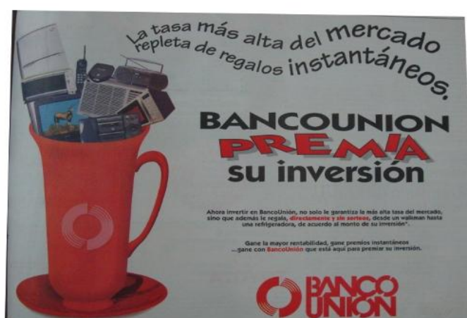
Imagén 2: Propaganda bancaria con la finalidad de atraer el ahorro.

que es necesario capitalizar a través de descontrolados (léase desregularizados) mercados financieros en concordancia con una “cultura de empresa” que va asociada a una doble reconstrucción del sujeto: una, en tanto “individuo emprendedor”, ya no completamente fijo a la relación riesgo-ahorro-protección sino en transición hacia una nueva relación riesgo-ganancia –si es que no totalmente anclado en ella–; y otra, “en la cual los individuos y grupos crecientemente son vistos no como ciudadanos sino como consumidores” (O’Malley, 2002: 108).