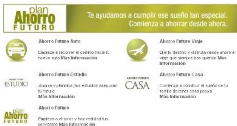
Imagen 1: Plan ahorro futuro.

necesidad sino a aquello que cada cual considera “indispensable” 30 para cubrir a futuro sus expectativas económicas, sociales y culturales. Ejemplo de ello, es el modo mismo en que las instituciones financieras presentan el ahorro: