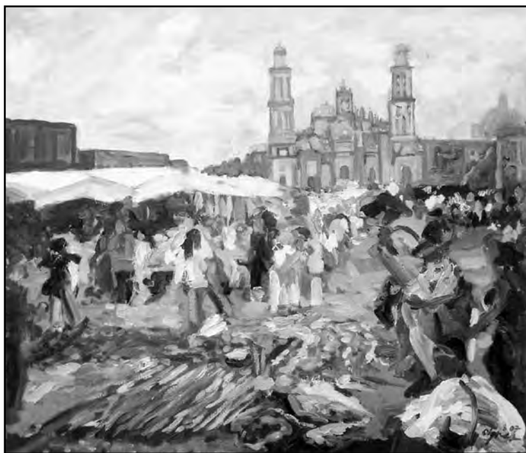
Sergio Elisea, 2007.