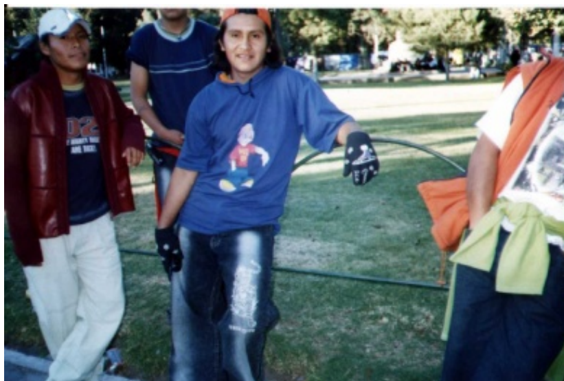
Foto N° 5. Un grupo de muchachos enamorando en la esquina del movimiento.