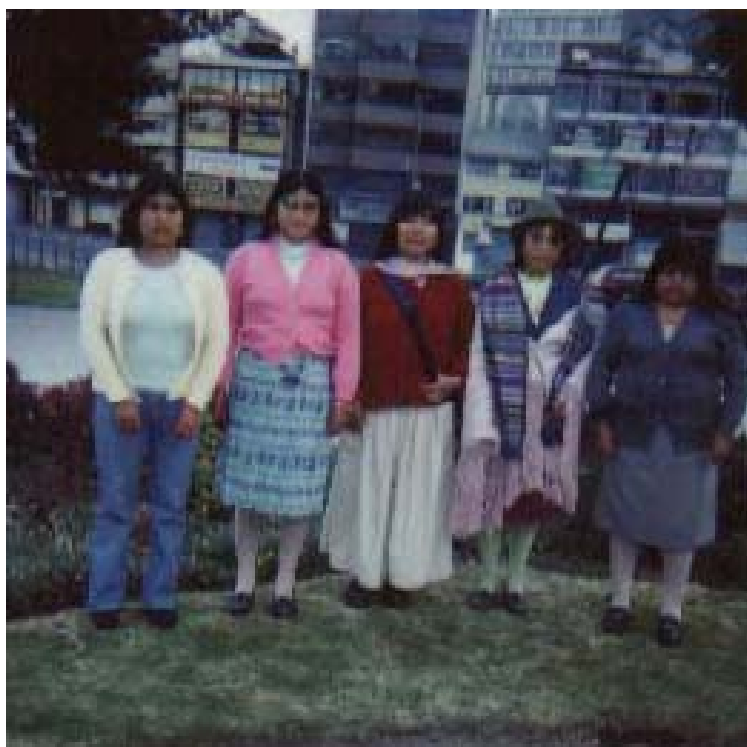
Foto N° 4. ¡Apenas raye el sol en nuestro rostro disparas la cámara! 29

Ton Salman y Eduardo Kingman (1999: 19) afirman que “si hacia la primera mitad del siglo XX la adopción de estilos de vida y sistemas de comportamiento “universales” competía únicamente a una elite de las clases altas y medias; hoy ello involucra, en mayor o menor medida, al conjunto de la población”. Esta afirmación me parece igualmente válida para la fotografía. Tomarse fotos, y poseer una cámara antes “de la universalización de los estilos de vida” era exclusividad de un grupo de personas con privilegio. Solo los ciudadanos mestizos podían hacerse fotografías en la vida cotidiana y en los grandes acontecimientos de la vida familiar.