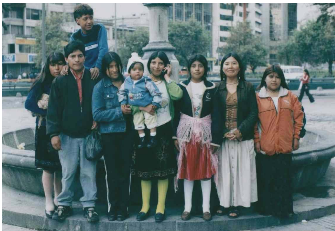
Foto N0 1. Un gran recuerdo en la pileta del fotógrafo.