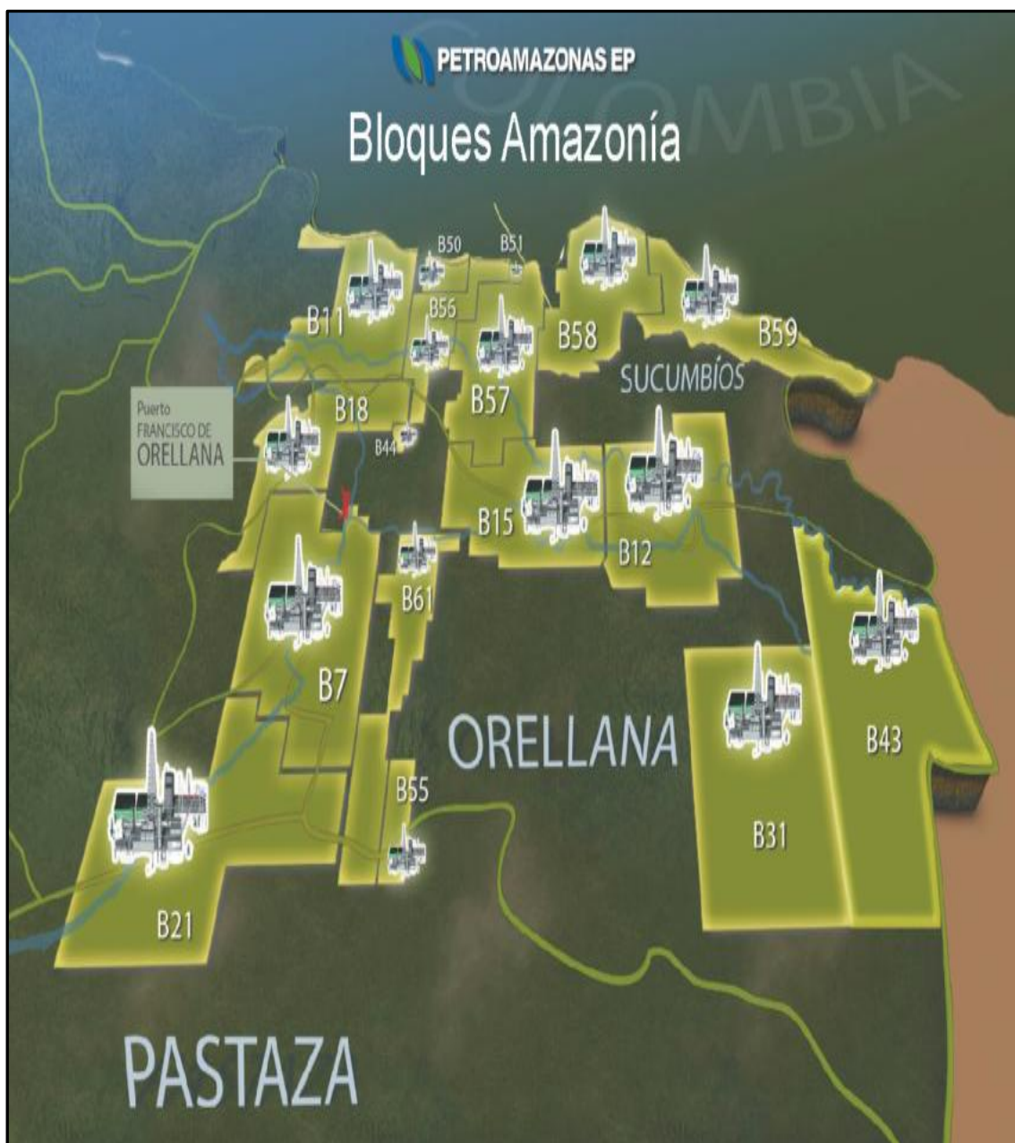
Fuente: Petroamazonas (2015). "Rendición de cuentas 2014". Página 6. Elaborado por: El autor.