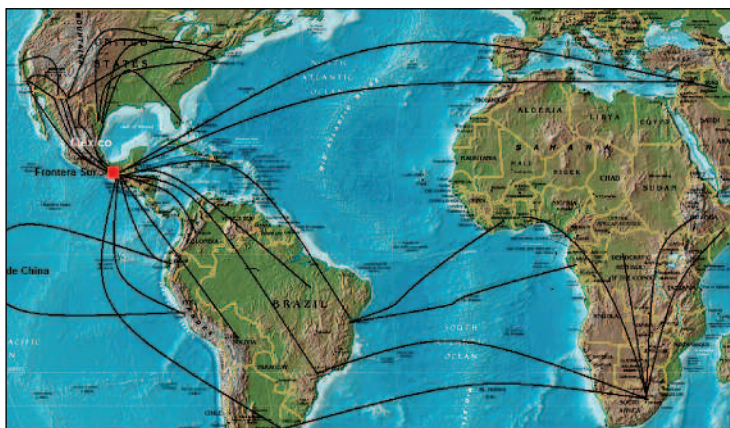
Mapa 2 Rutas migratorias de indocumentados que cruzan la frontera sur chiapaneca