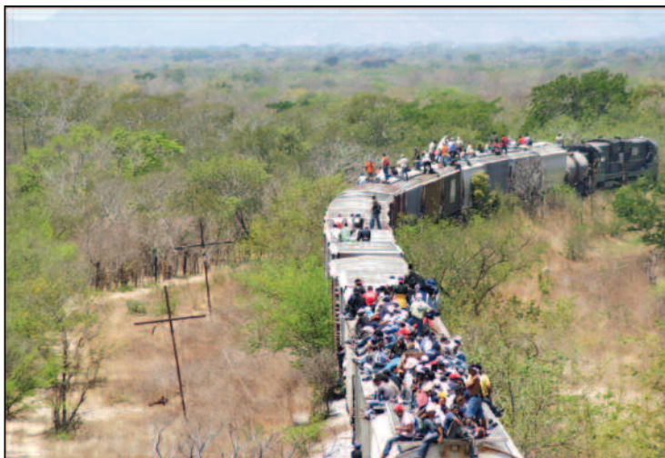
Arriaga, Chiapas.