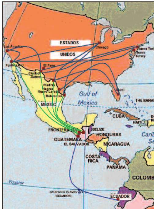
Mapa 3. Rutas migratorias de indocumentados ecuatorianos y centroamericanos