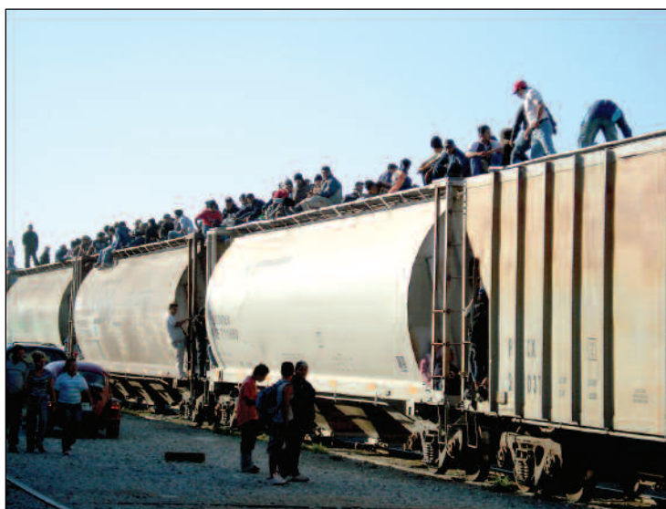
Arriaga, Chiapas.

Históricamente, Estados Unidos ha sido uno de los principales destinos de la migración andina. Sin embargo, muy poco se conoce sobre las diversas estrategias que ecuatorianos, peruanos, bolivianos o colombianos despliegan para sortear controles fronterizos estatales y, sobre todo, para hacer frente a la inmensa violencia que supone transitar de manera indocumentada y por rutas ocultas hasta la potencia del norte. En un contexto más amplio, a pesar de que la migración indocumentada de sur a norte constituye una de las más voluminosas a nivel mundial, su carácter clandestino y fugaz parecería haber limitado la investigación y por ende la visibilización de las estremecedoras experiencias por las que atraviesan los “sin papeles”. Esta invisibilización –quizá estratégica– ha influido a su vez en que los Estados de origen, tránsito y destino mantengan vigente la aplicación de políticas migratorias que se concentran únicamente en el control y seguridad fronteriza y dejan de lado el respeto de los derechos de los migrantes indocumentados en tránsito.