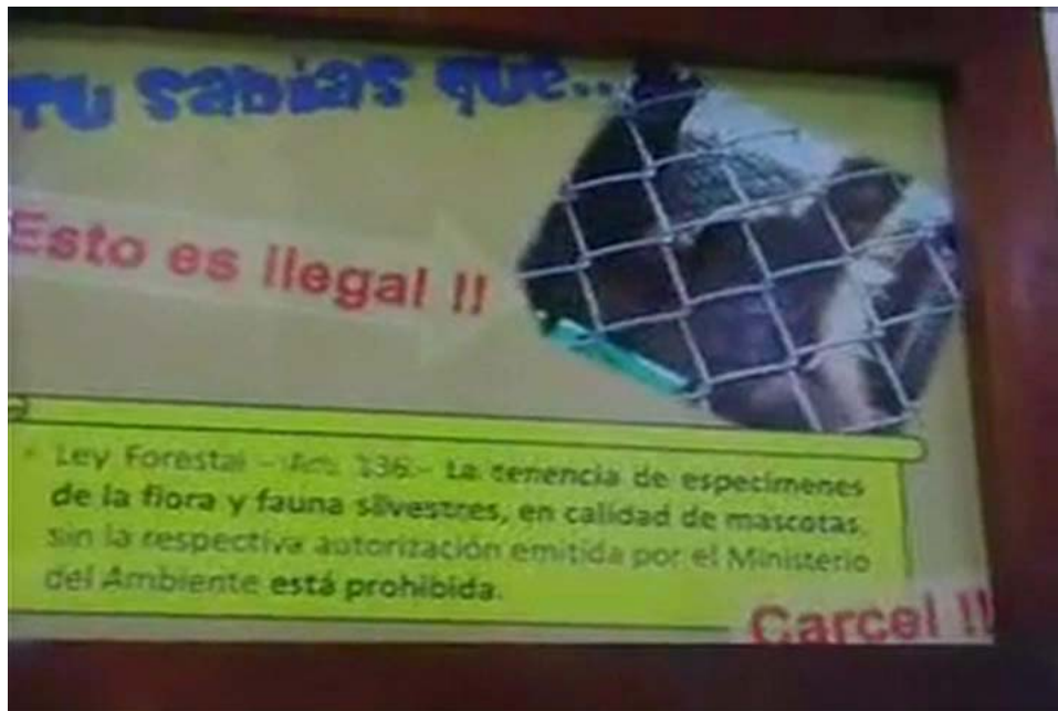
Imagen 7: Toma de la pancarta sobre el artículo 136 de la Ley Forestal (video “Biodiversidad”).

La participación de las estudiantes, se caracteriza por una observación distante, pues cada escena es locutada por una diferente voz de mujer en off y sólo visibilizan sus nombres en los créditos finales.