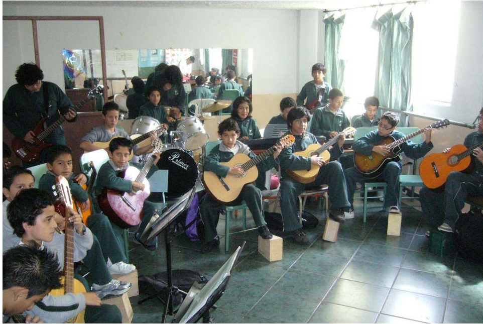
Imagen 4: Clase de música 45

Los directivos me explicaron que el modelo pedagógico que siguen es el constructivismo social crítico conformado en el aprendizaje de conocimientos previos, de conceptos pertinentes que permiten el enlace con los nuevos conceptos en la estructura del sujeto a través del proceso denominado como “integración obliterativa” como el proceso que explica la posibilidad de lograr un aprendizaje significativo”. La ilustración del Laboratorio de Ciencias muestra el equipamiento que disponen, un par de balanzas, un horno micro ondas, un quemador eléctrico y algunos tubos de ensayo más algunas muestras de reactivos completan sus recursos.