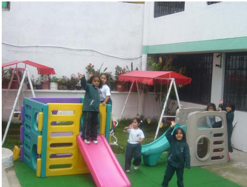
Imagen 2: Sección de educación inicial 43

Es un colegio que prácticamente atiende a la comunidad barrial en donde se encuentra que es el barrio 6 de julio de la Parroquia Chaupicruz. Funciona en sus instalaciones propias en una superficie de terreno de aproximadamente 4.000 m 2 . Al momento de nuestra investigación cuenta con un total de 368 alumnos repartidos de la siguiente manera: preescolar o educación inicial 97 alumnos, primaria o básica 107 alumnos y secundaria o bachillerato 164 alumnos.