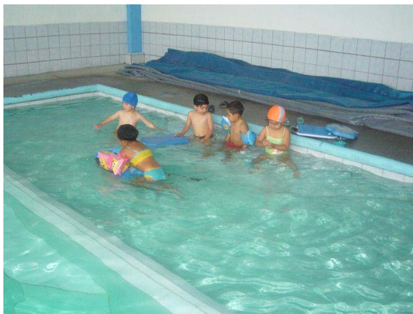
Imagen 6: Piscina del Liceo 48

Además el campus cuenta con una piscina que permite actividades lúdico - recreativas y clases complementarias de natación para los estudiantes. La presencia de la piscina da un plus en el imaginario de los estudiantes y es uno de los principales atractivos e incluso, un elemento decisor para los padres de familia; quienes consideran que una institución educativa de clase media se marca también por la infraestructura y servicios.