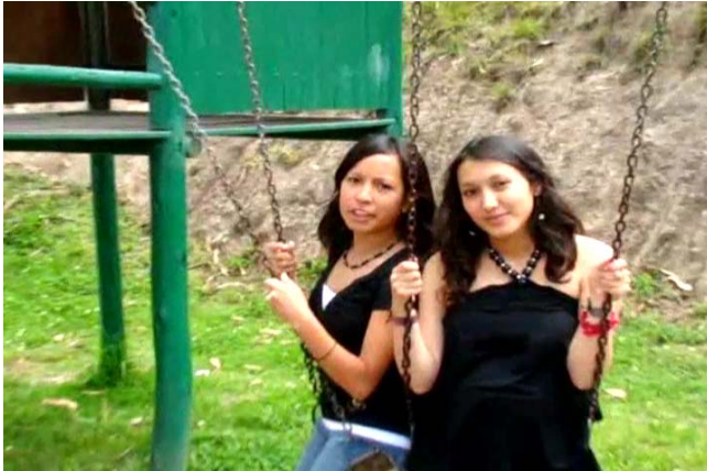
Imágenes 8: Presentadoras y locutores/as del video “El Reciclaje de Basura”.