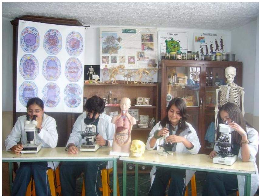
Imagen 5: Laboratorio de Ciencias 46

Dentro de este modelo, los directores de la Institución recogen la teoría de Vigotski 47 quien sugiere que el desarrollo cognoscitivo depende más de las personas a su alrededor, la cual se denomina “zona de desarrollo próxima” y comprende el área en la cual el niño no puede resolver el problema solo, requiriendo entonces la colaboración de otro niño más avanzado o la ayuda de un adulto. Las autoridades del Liceo esperan entonces que sus estudiantes de educación básica sean constructores de su propio conocimiento y los refuercen mediante un aprendizaje grupal.