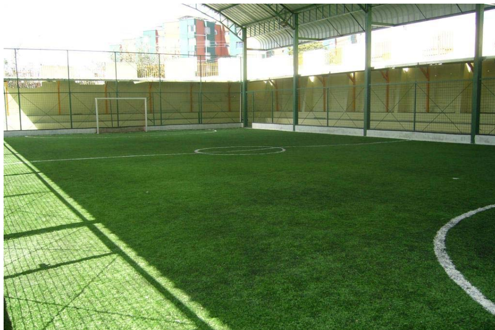
Imagen 3: Cancha del Liceo 44

La clase de música, una de las actividades de especialización con la que se creó el “Liceo” se desarrolla en la misma aula en la que reciben todas las demás clases. De una bodega en donde se guarda toda clase de enseres y artefactos se llevan al aula los instrumentos musicales. Las guitarras de madera, entre 15 o 20, son las más numerosas contando además con unas 4 guitarras eléctricas, un teclado y una batería. La hora de clase es más una hora social que una clase con algún lineamiento pedagógico. Los alumnos se apropian de sus instrumentos y el profesor dirige la interpretación de alguna composición o pieza musical del agrado del grupo cuyos acordes han venido ya repasando durante semanas. No hay ninguna atención personalizada, apenas indicaciones correctivas de lo que el profesor considera no suena bien.