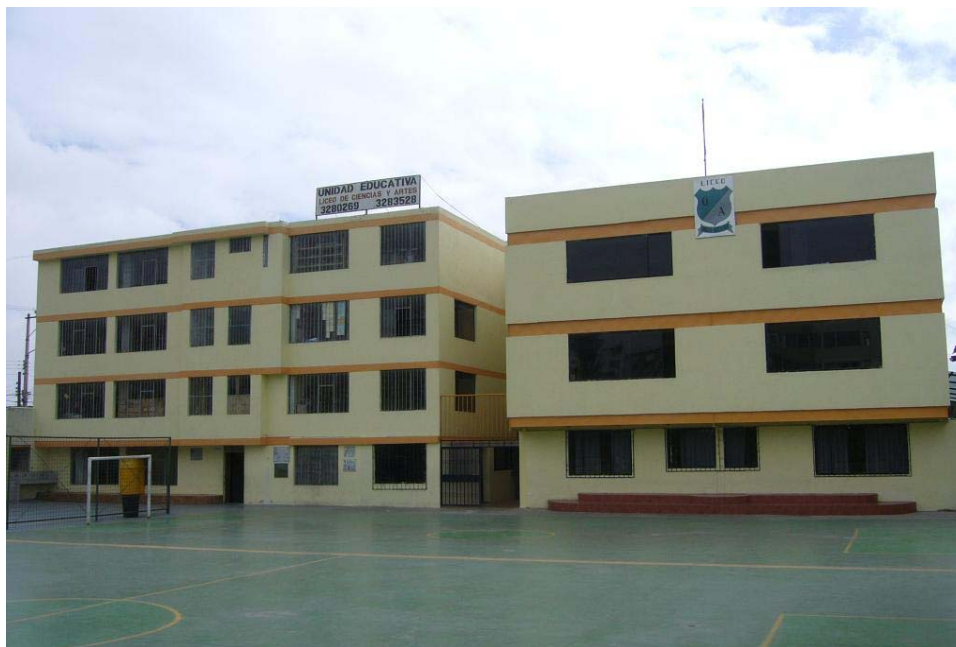
Imagen 1: Exteriores del Liceo 40

El Liceo nace de la necesidad de inculcar la formación artística del ser humano desde temprana edad, por lo que su misión como institución educativa es “la formación humana, intelectual, cultural y artística de sus estudiantes, preparándoles para que puedan defenderse en la vida con responsabilidad en sus deberes y derechos, que contribuyan eficazmente al bienestar de la comunidad; a través del dominio de la ciencia, técnica, la lengua materna y el inglés, así como también, el cultivo del talento creador de las artes como: danza, música y pintura. 41