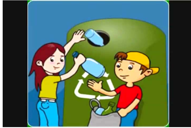
Imágenes 10: Reciclaje creativo