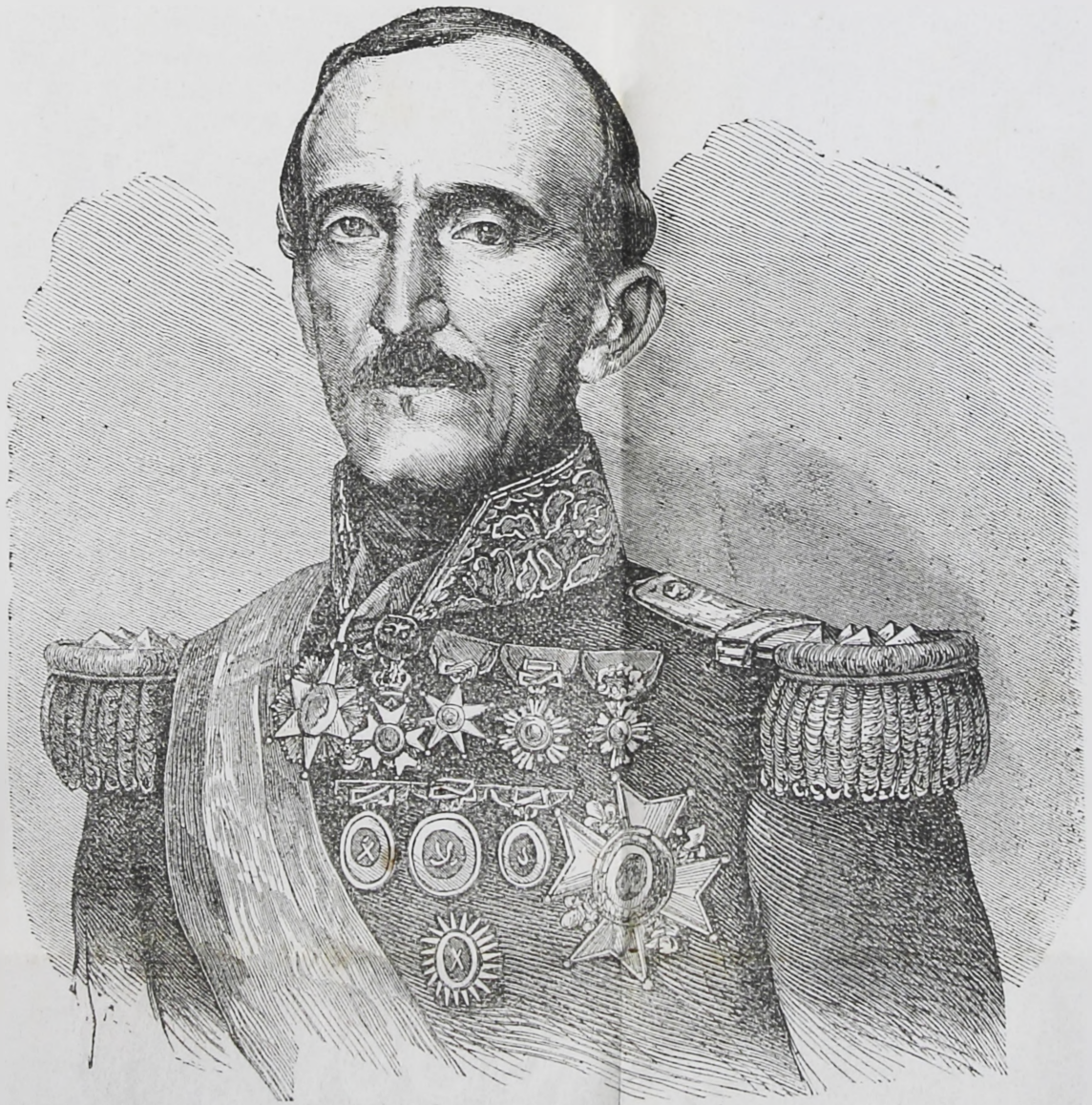
EL EXCMO. SEÑOR GENERAL JUAN JOSE FLORES, FUNDADOR DE LA REPÚBLICA DEL ECUADOR, SU PRIMER PRESIDENTE I GENERAL EN JEFE DE SUS EJERCITOS.