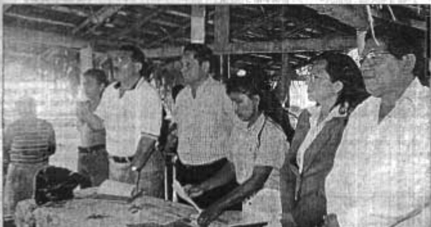
La gráfica captó en San Mateo la interrelación que se establece con las visitas que realizan los directivos de la U.B.M. a las diferentes zonas urbanas y rurales.

La necesidad de que estas expertas artesanas mejoren sus condiciones laborales y no caigan en manos de la explotación de los intermediarios ha motivado a la Unión de Barrios de Manta a ayudarlas a organizarse y a prepararse para administrar su producción.