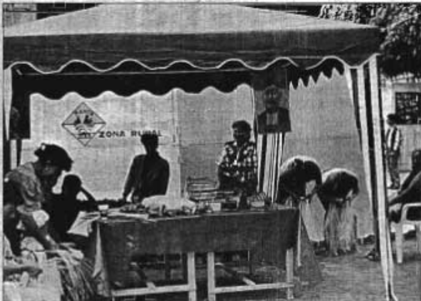
Las tejedoras de paja toquilla de la zona rural dejaron una gran impresión al exhibir su trabajo al público de Manta. La U.B.M. apoya a este grupo de trabajadoras ecuatorianas.

la Unión de Barrios ha sido favorable porque he conocido a otros dirigentes. Me ha dado la fuerza para seguir adelante porque este com-