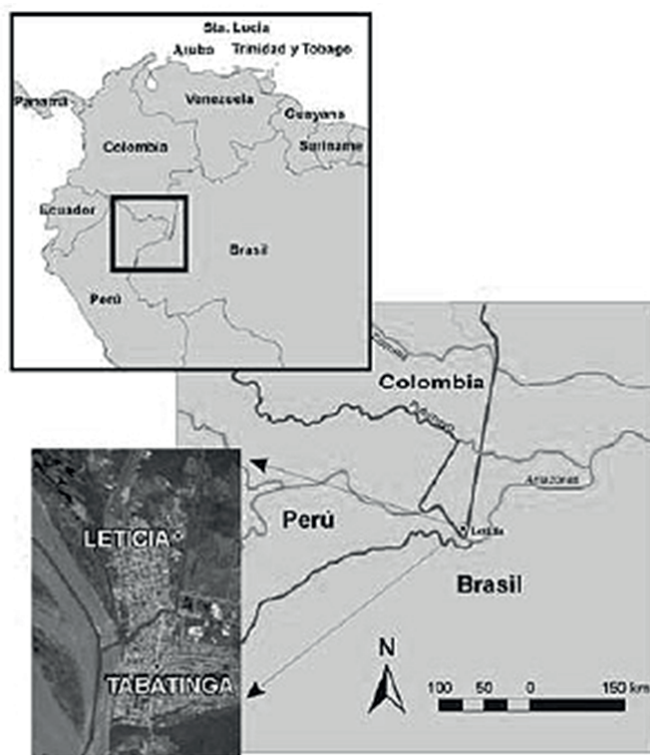
Mapa 2. La triple frontera del Medio Amazonas en Suramérica.

de las migraciones forzadas por los caucheros (Herrera Arango, 2014, p. 56). Estos grupos fueron atraídos a Leticia por la protección que las fuerzas militares colombianas –recién asentadas en dicha ciudad– podrían ofrecerles frente a la posibilidad de ser nuevamente explotados por caucheros peruanos (Echeverri, 1997; Herrera Arango, 2014) 3 . La segunda de estas migraciones se produjo en los años ochenta y noventa cuando grupos de la Gente de Centro huían de la acción de guerrillas, narcotraficantes, paramilitares, colonos e incluso del ejército en la cuenca del Caquetá-Putumayo (Franco, 2012).