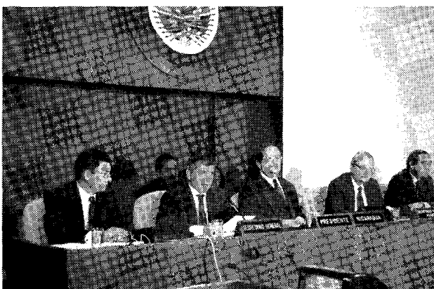
La OEA también afrontó el problema de la corrupción

En el afán de buscar escándalos políticos, muchos medios dan como notas ciertas los trascendidos. Los políticos y ciudadanos revisan con especial cuidado los trascendidos para saber quién aparece y por qué. Aquello es un albur, puede ser cierta o no la relación del hecho con tu nombre, pero no escapas de ser señalado. Aunque muchos de estos trascendidos han resultado ciertos, la difusión de estos ha generado un clima donde el rumor impera como una verdad y no como una opinión. Los ciudadanos han sido despiadados en sus juicios ante estos trascendidos.