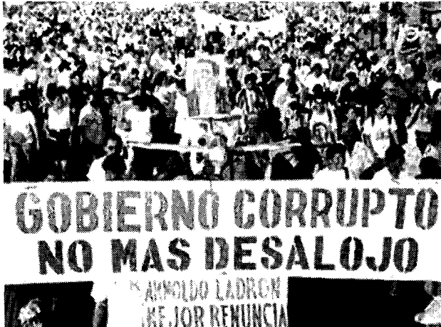
La protesta llegó a las calles

Tanto los medios como los políticos construyen sus expectativas en la inmediatez del presente. Se busca la nota y el escándalo para subir el rating, mientras los políticos están más preocupados por no aparecer en ellas y subir en las encuestas de la popularidad. El tiempo del discurso político es la coyuntura, no el futuro de una democracia ideal.