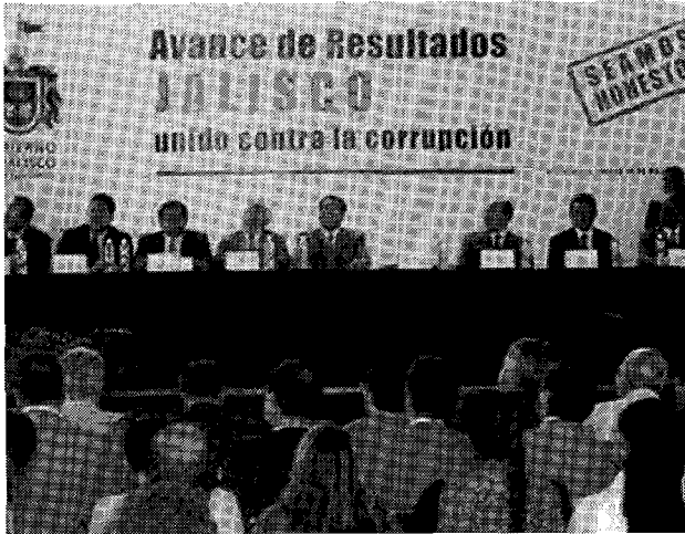
Acción popular contra la corrupción