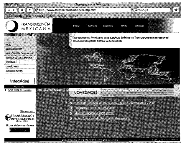
Se combate también desde la Internet

Por su parte, Carlos Ímaz supo de la existencia de un video sobre él. Se adelantó y admitió su culpa ante las cámaras, quizá esperando desactivar el impacto de la imagen a través de su dicho. Ímaz buscó invertir el proceso, connotar la imagen como un error de su parte para disminuir el impacto de las escenas denotadas. Para ambos personajes, sus actos fueron más un error que una acción corrupta.