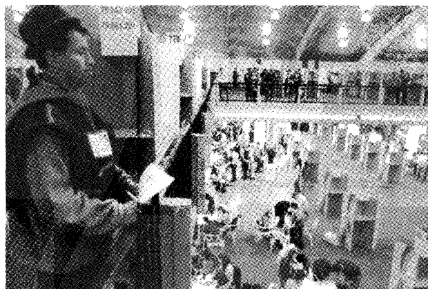
En calma votaron los colombianos