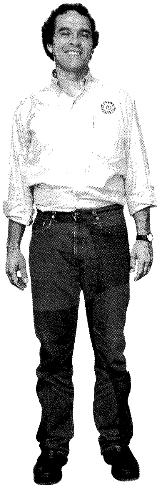
Sergio Fajardo, el nuevo alcalde de Medellín