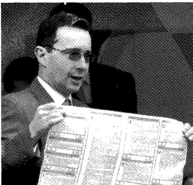
Uribe fracasó en el referéndum

Con una promesa de transparencia , una oferta de trabajo intenso y un mensaje de que para ver cosas no se necesitan ojos sino alma, se logró el cometido.