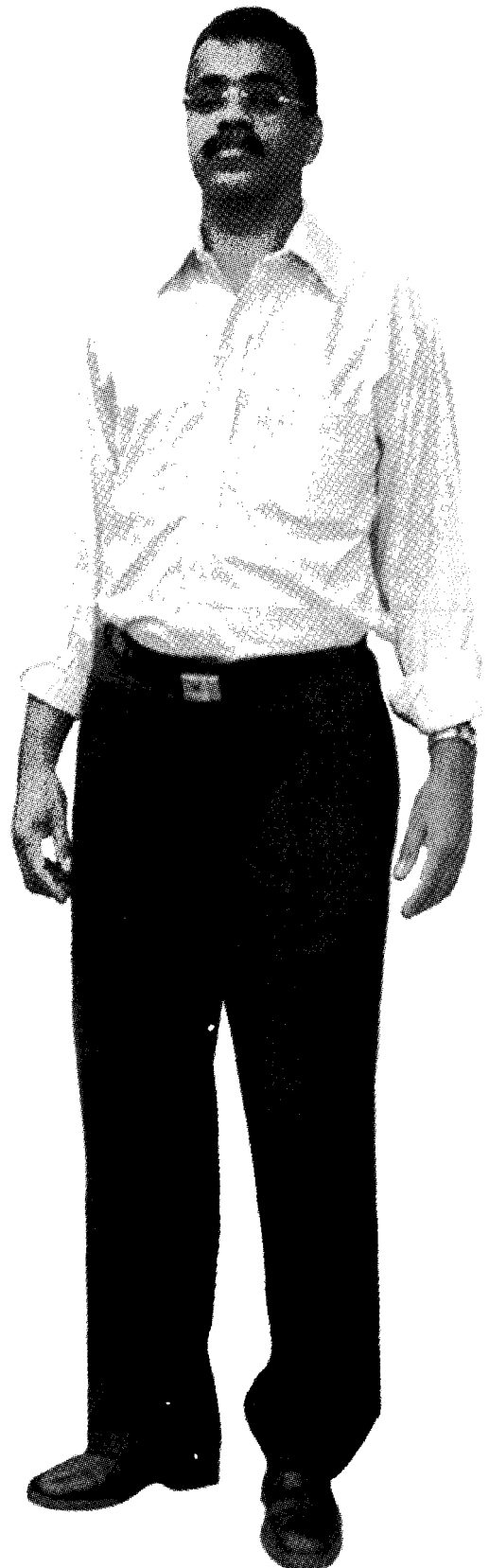
Salcedo, aunque ciego, es el nuevo alcalde de Cali

Apolinar Salcedo Caicedo tiene 49 años. Es ciego desde los siete años y él hace de su invidencia un arma inteligente de humor y de política. Por eso, su slogan para la campaña que en octubre lo hizo alcalde de una ciudad en la cual su empresariado se identifica fácilmente con el neoliberalismo rampante, no obstante las importantes fundaciones sociales que ha creado, "él ve lo que otros no ven".