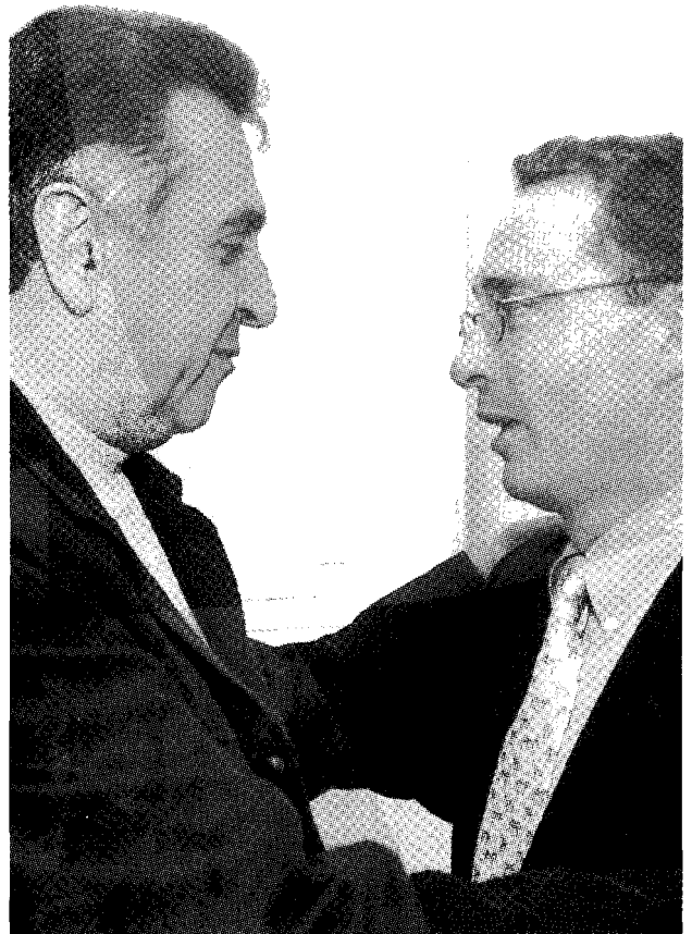
Garzón y Uribe

Un estudio de conducta política realizado en diciembre mostró que un porcentaje de electores lo hizo porque conocía a Polo o había recibido sus servicios. Otro, por cansancio con la clase política dominante. Unos más por reacción social contra el establecimiento. Y, algo importante, un porcentaje singular, en solidaridad con la invidencia del candidato.