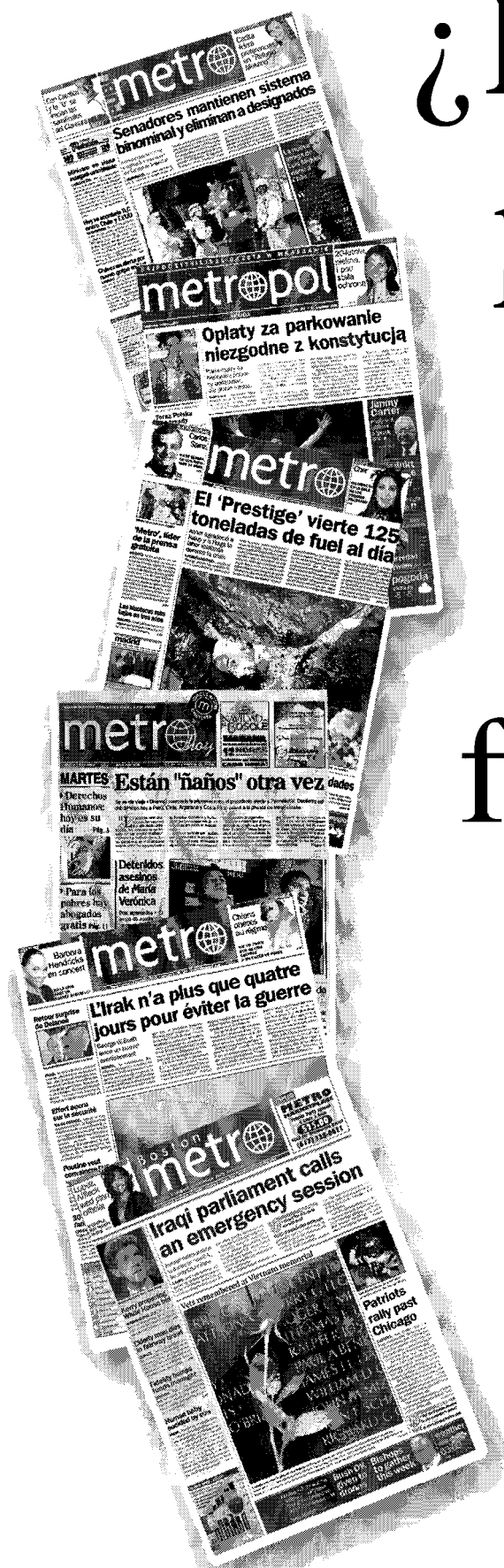
El fenómeno global de la cadena gratuita "Metro"