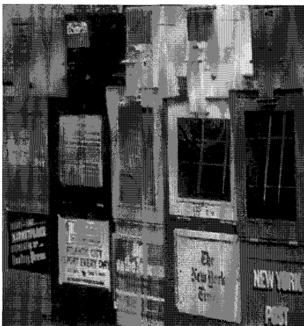
Las máquinas expendedoras de diarios

delo ciertamente diferenciado de la de pago. El primer rasgo distintivo es la ausencia de confrontación política. Se trata de un periodismo que pone el acento en el interés humano de los acontecimientos, más allá de las meras declaraciones partidistas y que busca sobre todo la difusión de informaciones cercanas al lector, algunas de las cuales no tienen cabida normalmente en la prensa de pago. En este sentido, resulta muy esclarecedora la apuesta de todos los gratuitos por las ediciones locales. Un hecho que no está ligado únicamente a su sistema de distribución en el transporte público metropolitano, sino que responde en gran medida a un modelo de periodismo de proximidad y que se refleja también en otros aspectos, como el tratamiento personalizado de la información, con la identificación abundante de los protagonistas de las noticias y profusión de fotografías con gente de la localidad. La ausencia de contenidos políticos, por el contrario, sí que encuentra su justificación en el modelo de negocio, porque, como sostiene Ramón Pedrós, director editorial de Metro Internacional para España, “yo no quiero que nadie me rechace el periódico”. Así, mientras una determinada filiación política puede ser un atributo que haga decantarse al lector por un diario concreto, entre la oferta variada de un quiosco, esta misma filiación puede actuar como un elemento refractario del periódico que se entrega gratuitamente.