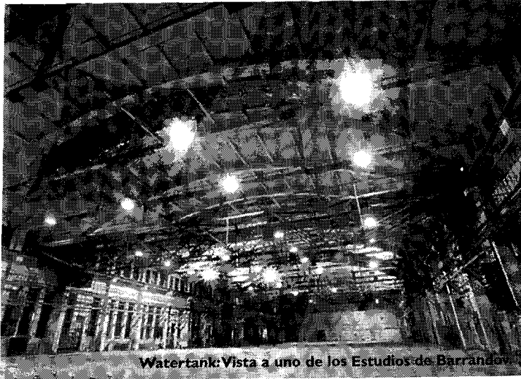
Watertank: Vista a uno de los Estudios de Barrandov.