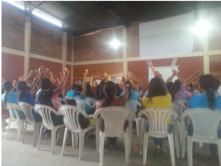
Figura 10. Socios y socias de Kallari en Asamblea para elección de nueva Junta Directiva de la asociación.