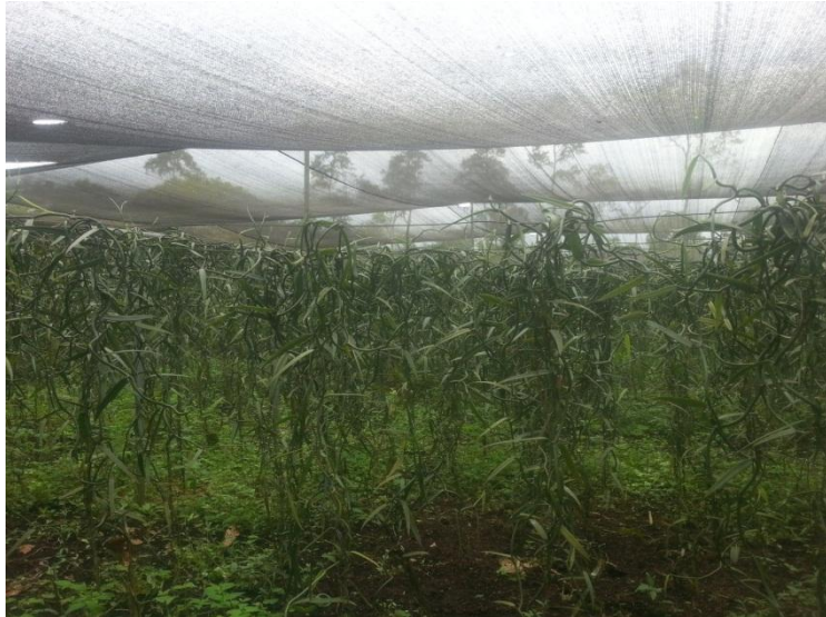
Figura 11. Plantación de vainilla en el vivero de la Asociación Kallari.