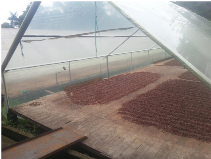
Figura 12. Marquesina en el centro de acopio de la Asociación Kallari.