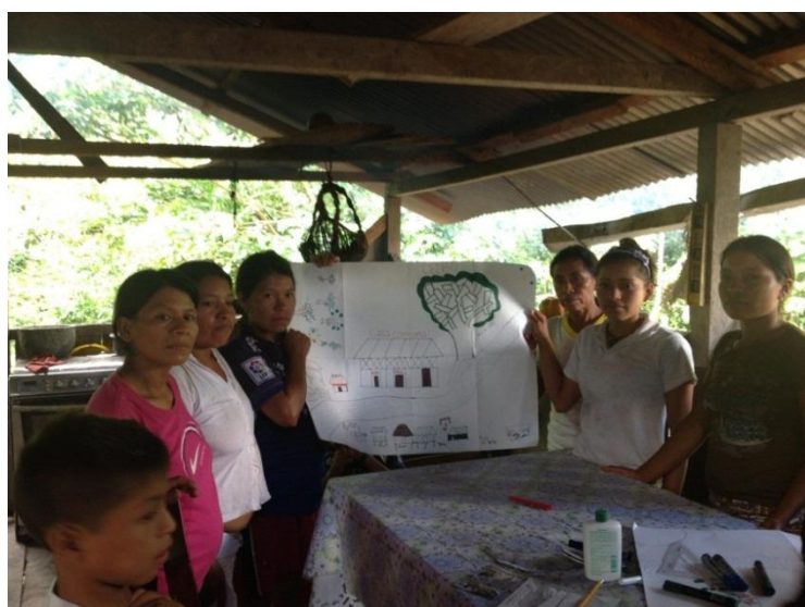
Figura 3.1. Cartografía social Comunidad Santa Bárbara. Grupo de mujeres.

En este capítulo a través de la construcción social de los espacios en la Comunidad Santa Bárbara, analizo las jerarquías que subyacen en la separación de espacios públicos y privados, lo que junto con la división sexual del trabajo y los modelos de feminidad y masculinidad, tienden a naturalizar las cargas de trabajo diferenciadas y las responsabilidades asociadas a la gestión de la reproducción de la vida en la comunidad. Para esto realicé un taller de cartografía social con diez miembros de la comunidad, en el que un grupo de hombres y un grupo de mujeres dibujaron la comunidad, las casas y una chakra . En el taller identifiqué cómo cada grupo construye los lugares, esto refleja con qué actividades se sienten identificadas las personas y la valoración social de las mismas. A continuación presento fotografías del taller y los mapas de la Comunidad Santa Bárbara: