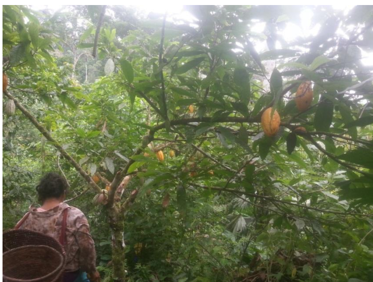
Figura 1. Filomena Tapuy en una de sus chakras en la que cultiva cacao fino y de aroma para Kallari. Comunidad Santa Bárbara.