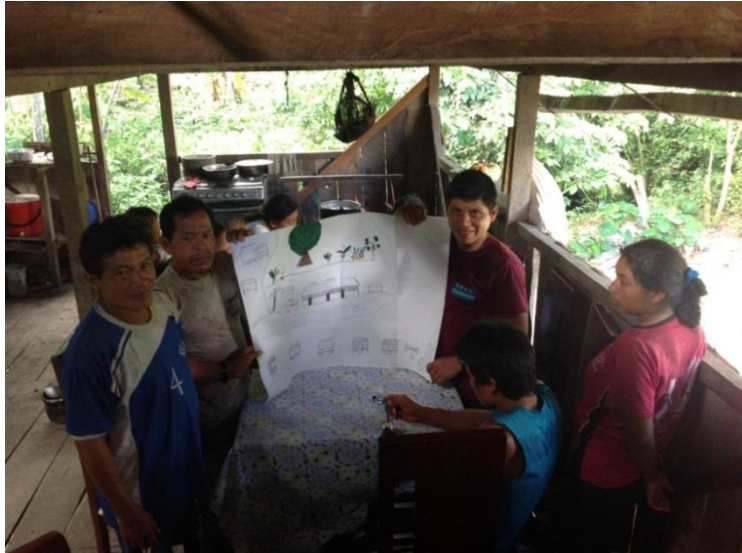
Figura 3.2. Cartografía social Comunidad Santa Bárbara. Grupo de hombres.