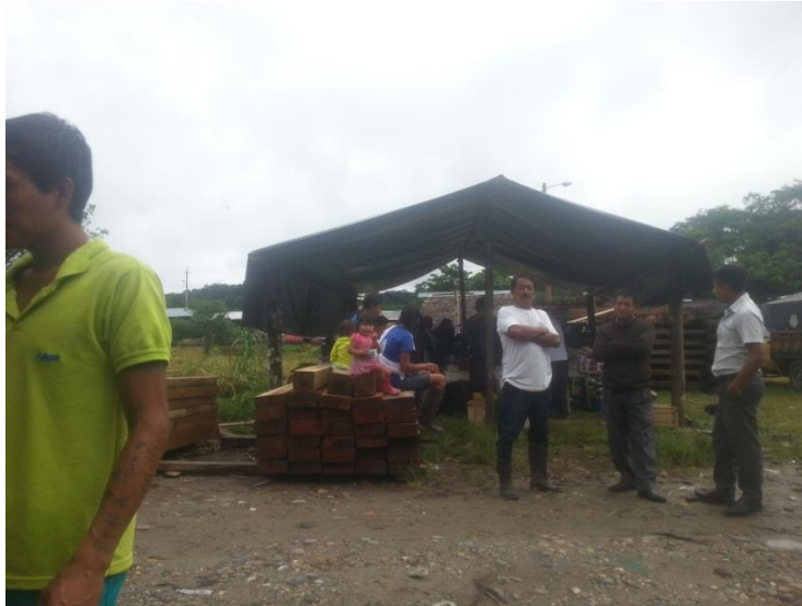
Figura 9. Hombres y wawas de la Comunidad Puni Bocana junto a madera lista para su venta a intermediarios.