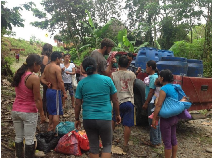
Figura 3. Personas de la Comunidad Santa Bárbara vendiendo cacao en baba a voluntarios que trabajan en la Asociación Kallari. Puente de San Pedro.