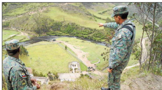
Militares dicen que los haitianos usan el paso irregular de El Brinco, a 2 km de Tulcán. Fotos: Francisco Espinoza para EL COMERCIO http://www.elcomercio.com/actualidad/haitianos-colombia-pasos-ilegales-migracion.html

En la sección de migración y cultura, Gabriela Alvarado comenta el evento de presentación de la actividad "Bitácora de una expulsión" llevado a cabo por el Colectivo Atopía, evento que reconstruye la crítica situación de detención y expulsión de los cubanos migrantes en Ecuador en 2016. Esto con el fin de que la memoria colectiva sirva para reflexionar sobre este tipo de hechos para que no queden ocultos.