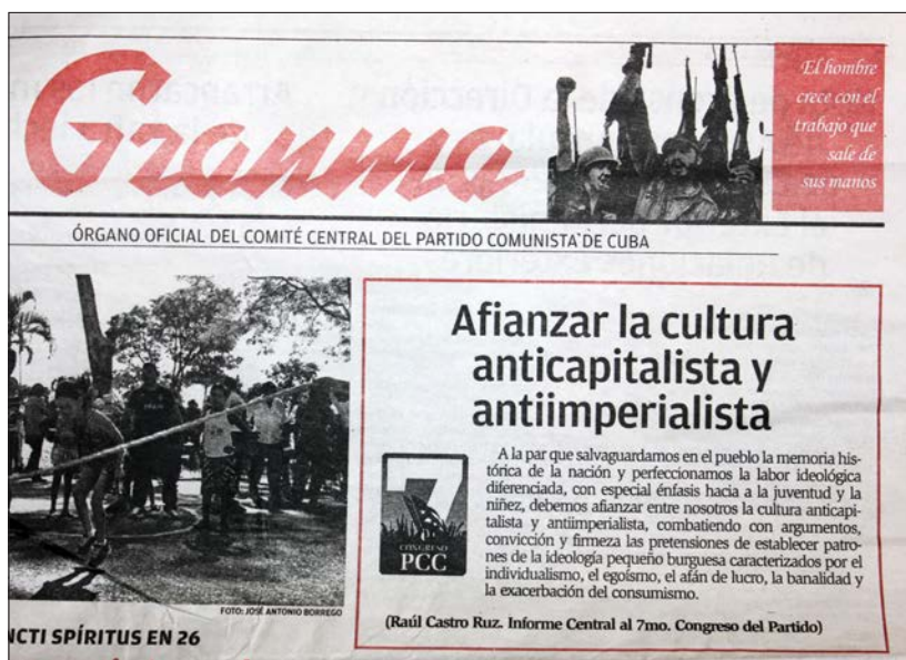
Fragmento del Informe central al 7mo. Congreso del Partido Comunista de Cuba refiriéndose a la cultura en la primera plana del periódico Granma, órgano oficial del Comité Central del Partido Comunista de Cuba, 12 de julio de 2016.

La Bienal de La Habana surgida en 1984 se fundó como la bienal del “tercer mundo” que incluiría en sus eventos —y con suerte en el sistema del arte internacional— a los artistas de África, Asia, el Caribe y América Latina. La voz oficial ha sido la del arte de izquierda, antihegemónico, anticapitalista y solidario. Crecimos escuchándola mientras las instituciones culturales estatales censuraban el arte que consideraban contestatario. En esta situación, el enfrentamiento a la escena del espectáculo capitalista ha sido el discurso estatal; el enfrentamiento a la escena del espectáculo ideológico, autoritario y totalitario ha sido el reclamo del mundo intelectual. Esta situación ha creado un panorama singular para el arte cubano involucrado con el contexto político y social en el que se encuentran nuevos matices: la oficialización del enfrentamiento con la escena del espectáculo capitalista sustituido por el espectáculo ideológico, a su vez enfrentado por el arte.