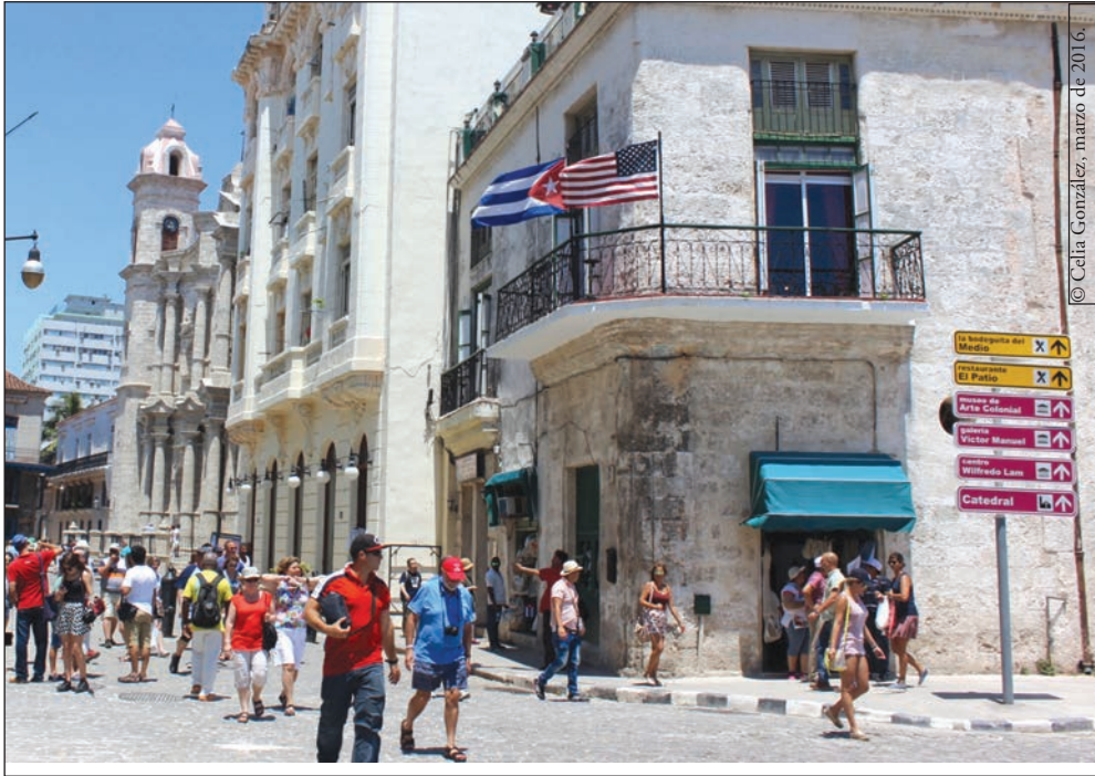
Fotografía 1. Las banderas cubana y estadounidense izadas juntas en La Plaza de La Catedral, La Habana Vieja.