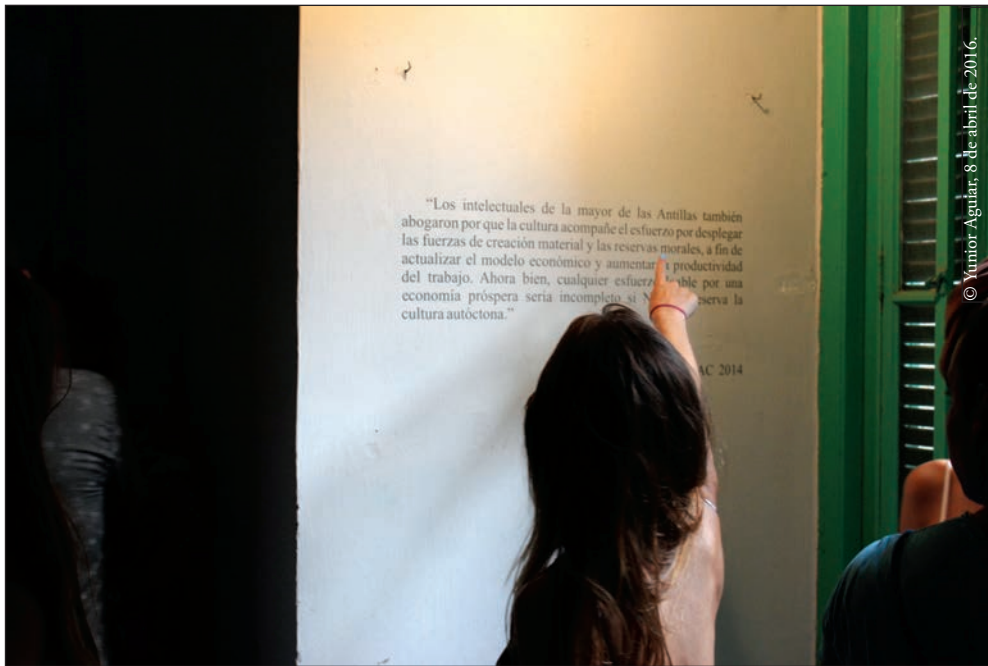
Fotografía 7. Asistente a la inauguración de Cultura autóctona señalando la cita de las declaraciones del VIII Congreso de la UNEAC.

La cultura aparece aquí como una definición conservadora, a la que se apela como un espacio protegido de todo mal; lo correcto se encuentra ahí, lo naturalizado, lo “nuestro”, lo autóctono y solo lo que quepa allí será legítimo. En la cita, ha sido resignificada como concepto hasta ser volcada a los intereses más conservadores y convenientes. Según Michel-Rolph Trouillot, antropólogo social haitiano, la cultura ha sido utilizada de manera abusiva para explicar conflictos económicos y políticos fuera del mundo académico que le dio origen como concepto —el campo de la antropología—: “Una palabra destinada a promover el pluralismo usualmente se vuelve un tropo en los programas conservadores o en las últimas versiones liberales del proyecto civilizador” (2003, 188).