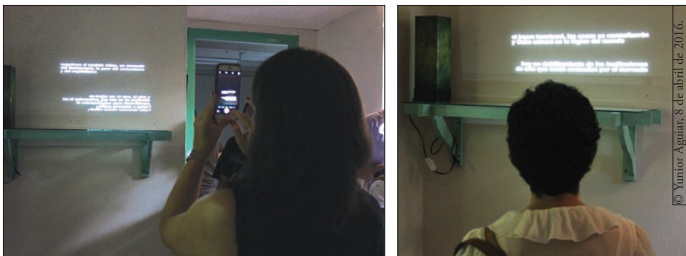
Fotografías 4 y 5. Críticos de arte ante la proyección de las frases recogidas en mi diario de campo de enero a abril de 2016.