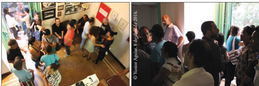
Fotografías 8 y 9. Participantes de la escena del arte cubano; público asistente a la inauguración de Cultura autóctona .

Como práctica curatorial dirigida al mundo del arte, los creadores de esta exposición vigilábamos los niveles de efectividad de Cultura autóctona como generadora de significados, a la vez que en una doble agencia exigida por el propio evento, vivíamos la práctica etnográfica atenta a la situación de la escena del arte cubano actual y su repercusión en la producción de un arte involucrado con su contexto social.