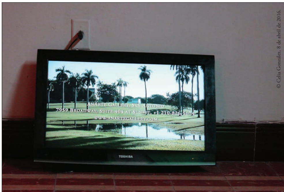
Fotografía 6. Pantalla emplazada en el suelo reproduciendo el segundo bloque de información correspondiente al ámbito pedagógico.

Desde 2009 aproximadamente, se ha hecho habitual la visita de turismo cultural a los talleres de la universidad: buses de estadounidenses arriban a la Facultad para apreciar su arquitectura –las construcciones del ISA han sido declaradas Monumento Nacional en 2013– y comprar obras de estudiantes y profesores; situación que ha sedimentado un espacio pedagógico girado a la producción de lo que se puede ofertar. La Facultad de Artes Visuales del ISA ha sido responsable de la formación de la mayoría de los artistas del país, identificada por un predominio de la obra construida desde su propuesta conceptual. El video condensaba esta situación actual con la utilización de dos elementos: el paisaje del ISA –ampliamente reconocible por el público del arte en Cuba y que cumple con elementos del esperado paisaje cubano, soleado, verde y con palmeras– como símbolo de lo autóctono, de la cultura como espacio inocente, amigable, sobre el que se informa del segundo dato: los contactos de las galerías norteamericanas que lo visitan y condicionan.