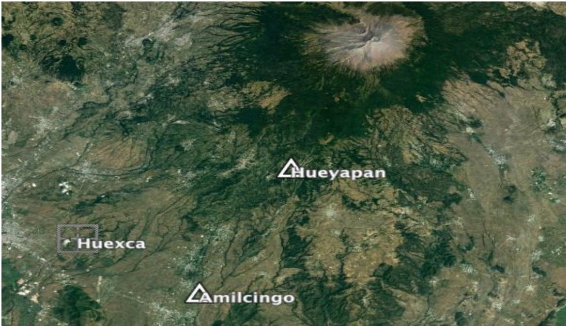
Mapa 3. Localización del pueblo de Amilcingo y de Huexca.