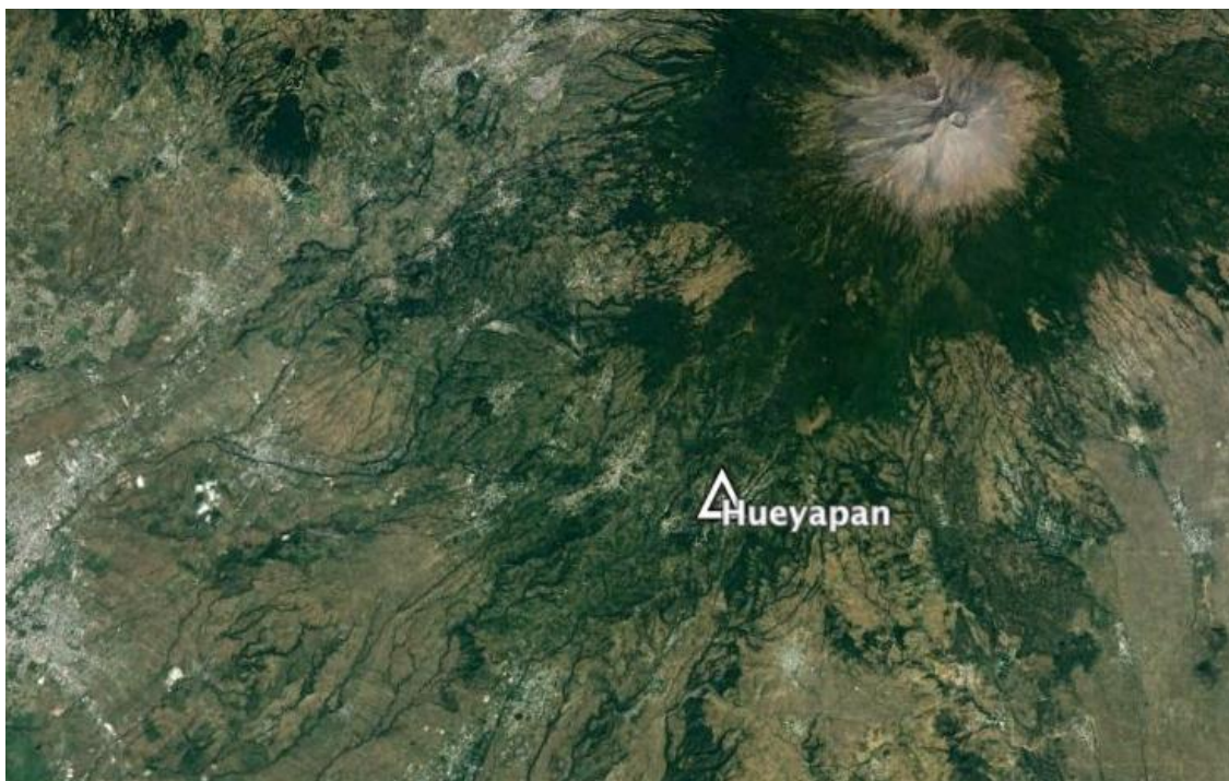
Mapa 1. Posición de la comunidad de Hueyapan en relación a la proximidad del volcán Popocatepetl.

destacó el fomento de una acuacultura extensiva, llevada a cabo a través de la introducción de criaderos de trucha a las faldas del volcán Popocatepetl. Asimismo, la introducción de algunos tipos de árboles frutales como la granada colombiana y diversas variedades de aguacate constituyeron nuevas formas de producción que transformaron también las necesidades de la población, así como la manera de administrar los recursos.