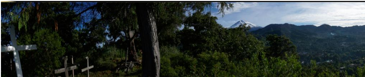
Foto 1. El volcán Popocatepetl visto desde el cerro Chigonkiuhtl.

También me explicó la diferencia entre amiale que refiere al lugar donde nace el agua, y los ahuaque que refiere a aquellos que “crean el agua”. La manifestación de los guardianes del agua, desde Tláloc, los ahuaques y los propios hueyapeños se materializa en el caso de Hueyapan, a través de una topografía ritual y tecnológica que involucra al volcán Popocatepetl al norte, pasando por diferentes cerros en dirección al sur, como el cerro Quetzaltépetl, el del Gallo, el Coatltepetl, el Chigonkiuhtl (foto 1) y, finalmente, el Texcal Pintado, con petrograbados de Tláloc a orillas del Amatzinac.