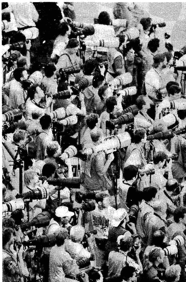
Caoçalera 70, España