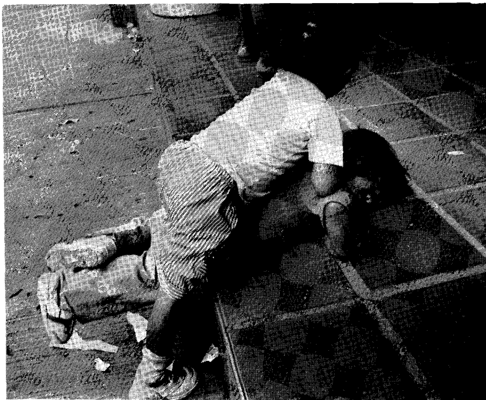
"En E.U.: un niño de 13 años ha visto 8.000 asesinatos en la TV, ¿cuántos en A. L.?"

El socorrido argumento de los responsables de la TV de que esa transmisión es inocua, porque se exhibe tarde en la noche una película "solo para adultos" o con esa confusa reserva de que es "solo para personas con criterio formado", resulta una ficción desde el momento en que los padres salen de casa o los menores de edad tienen un televisor en su habitación y florece, además, el libre comercio de alquiler de videos, generalmente piratas.