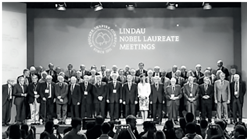
Figura 2. Reunión de premios Nobel en Lindau (Suiza) en 2015. La mujer que aparece no es científica, es una condesa según informa el diario.