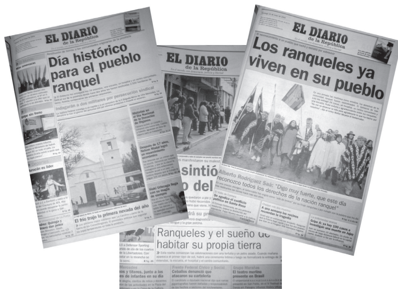
Figura 1. Notas de tapa que difunden la inauguración del pueblo.

Por otro lado, cuando la noticia se matiza con el discurso de algún representante indígena, más que para recuperar sus perspectivas sobre los hechos, su cultura y proyección de vida, se realiza a los fines de valorar la acción y gestión gubernativa. El periodista cuenta como el representante de la comunidad Coya de Jujuy “sostuvo que es necesario que los demás gobiernos se contagien de San Luis” (El Diario de La República, 2007, noviembre 28, p. 14) y también en otras citas aparece la voz de un representante rankülche afirmando: “A mí me va a ser poca la vida para terminar de agradecerle a Rodríguez Saá lo que ha hecho por nosotros” (El Diario de la República, 2009, mayo 31, p. 4).