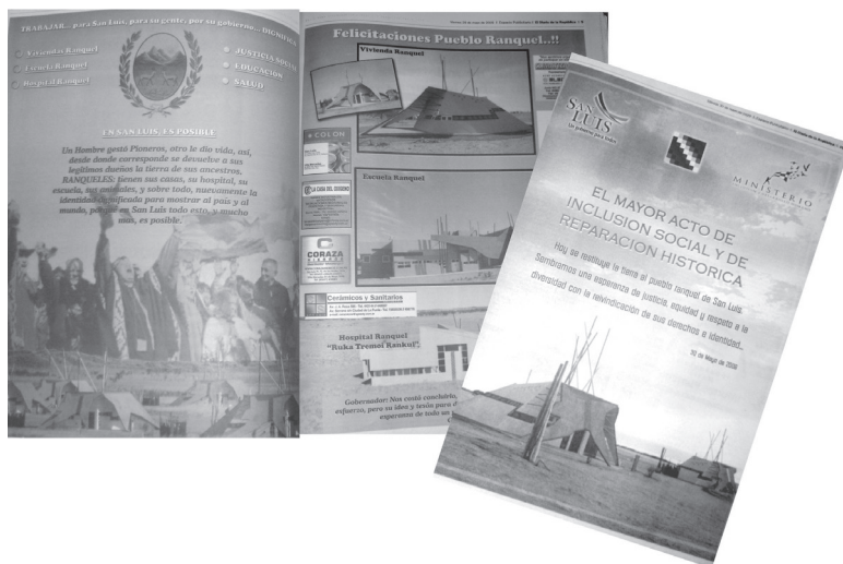
Figura 2. Propaganda política sobre los actos de reivindicación hacia los rankülches .

Por otra parte, la propaganda estatal fue utilizada además para invitar al público a la ceremonia de restitución de tierras y de entrega de las viviendas (Figura 3). En estos casos vale advertir sobre la imagen utilizada de Pincen –un reconocido cacique rankül – para representar a los indígenas rankülches que “triunfantes...VUELVEN”, reafirmando en ese texto la idea de recuperar su territorio original. La fotografía seleccionada con el torso desnudo, el chiripá, la vincha, las boleadoras y la lanza, reproduce una visión estereotipada del indígena que, a su vez, se refuerza con la representación que lo asocia con la ruralidad. Es posible pensar que tal elección se relaciona con la intención de exhibir y difundir una imagen que fuese fácilmente identificada por la sociedad con “lo indio”, a partir de la presencia de elementos específicos a este asociados.