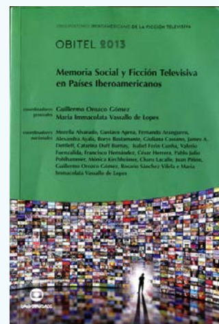
Anuario Obitel 2013 Memoria social y ficción televisiva en Iberoamérica

Pero como revela el Anuario, el "gran destaque" estuvo en la propia ficción histórica creada para la TV como "forma de archivo de la nacionalidad