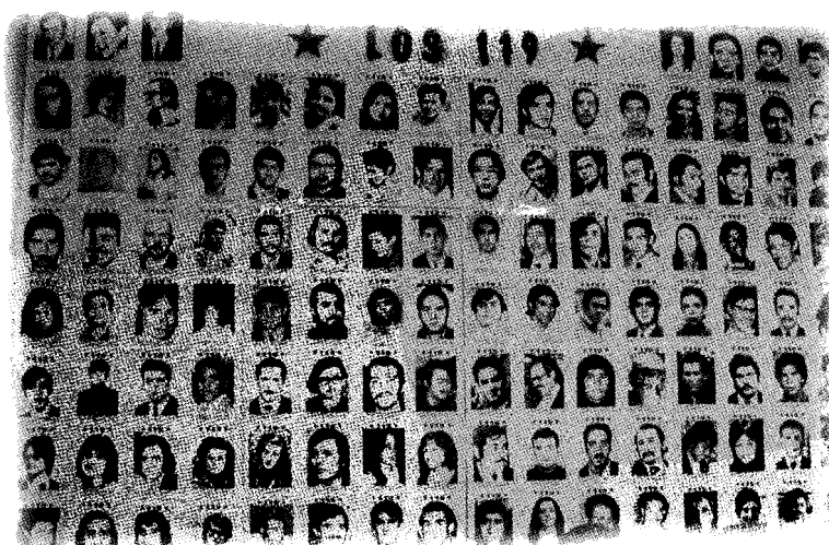
Galería de desaparecidos

Entre los periodistas se impuso una nociva práctica, cuyos efectos aún se perciben en la prensa nacional : la autocensura