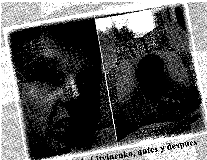
Aleksandr Litvinenko, antes y después