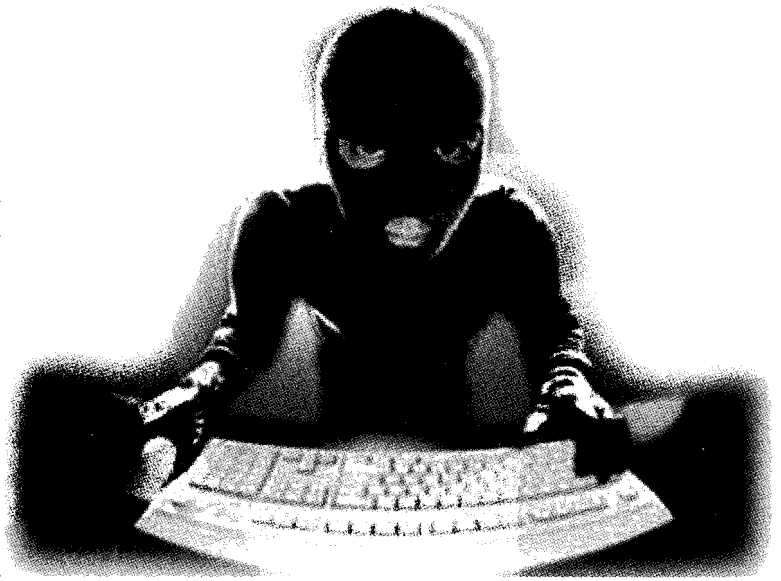
Los hackers tuvieron un rol protagónico en la campaña contra López Obrador

Los ciberguerrilleros al servicio de Felipe Calderón y el PAN emprendieron una intensa campaña de propaganda negra, cuyo objetivo fue atemorizar a la ciudadanía, describiendo un panorama apocalíptico que se viviría en México de triunfar López Obrador. Decían que se desatarían estatizaciones, se perderían los más