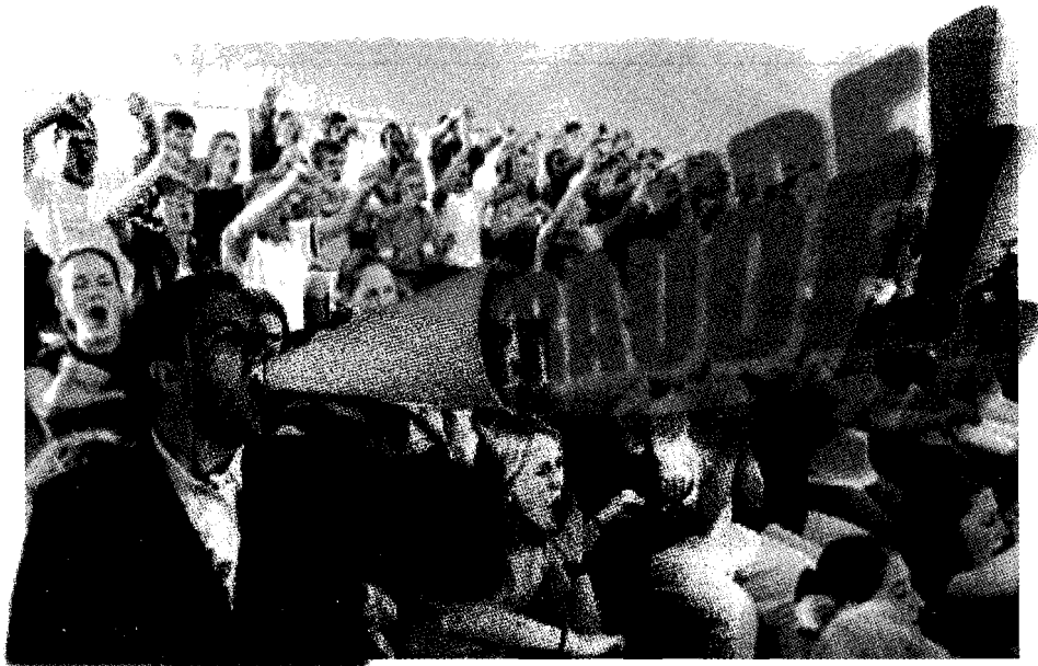
El estrecho margen de los resultados alimentó el rumor del fraude

En las acciones de "propaganda negra" a través de Internet destacaron las siguientes cuentas de correo: efelipe@df.pan.org.mx , boletin@felipe.org.mx , boletin@fundacion-christlieb.org.mx , contacto@mexicohonesto.org . Entusiastas simpatizantes de Felipe Calderón promovieron cadenas con mensajes contra López Obrador. Grupo SocCivil [ gruposoccivil@yahoo.com ], por ejemplo, afirmó contar con pruebas sobre los delitos en los cuales incurrió López Obrador para asegurar el financiamiento de su campaña presidencial. La liga hacia el sitio web en el cual supuestamente podían consultarse tan contundentes pruebas [ http://soccivil2.c.topica.com/maaeV9NabrBeuburKLgcaeQzcY/ ] nunca funcionó. Grupo México [ grupo.libertad@gmail.com ] advertía sobre la inminente devaluación de la moneda tras el triunfo de López Obrador, destacando supuestas irregularidades de López Obrador en el manejo de las finanzas del Distrito Federal. Correos electrónicos que partían de la cuenta [ ernestogranja06@hotmail.com ] denunciaron que López Obrador deseaba acabar con el "mito y fanatismo guadalupano".