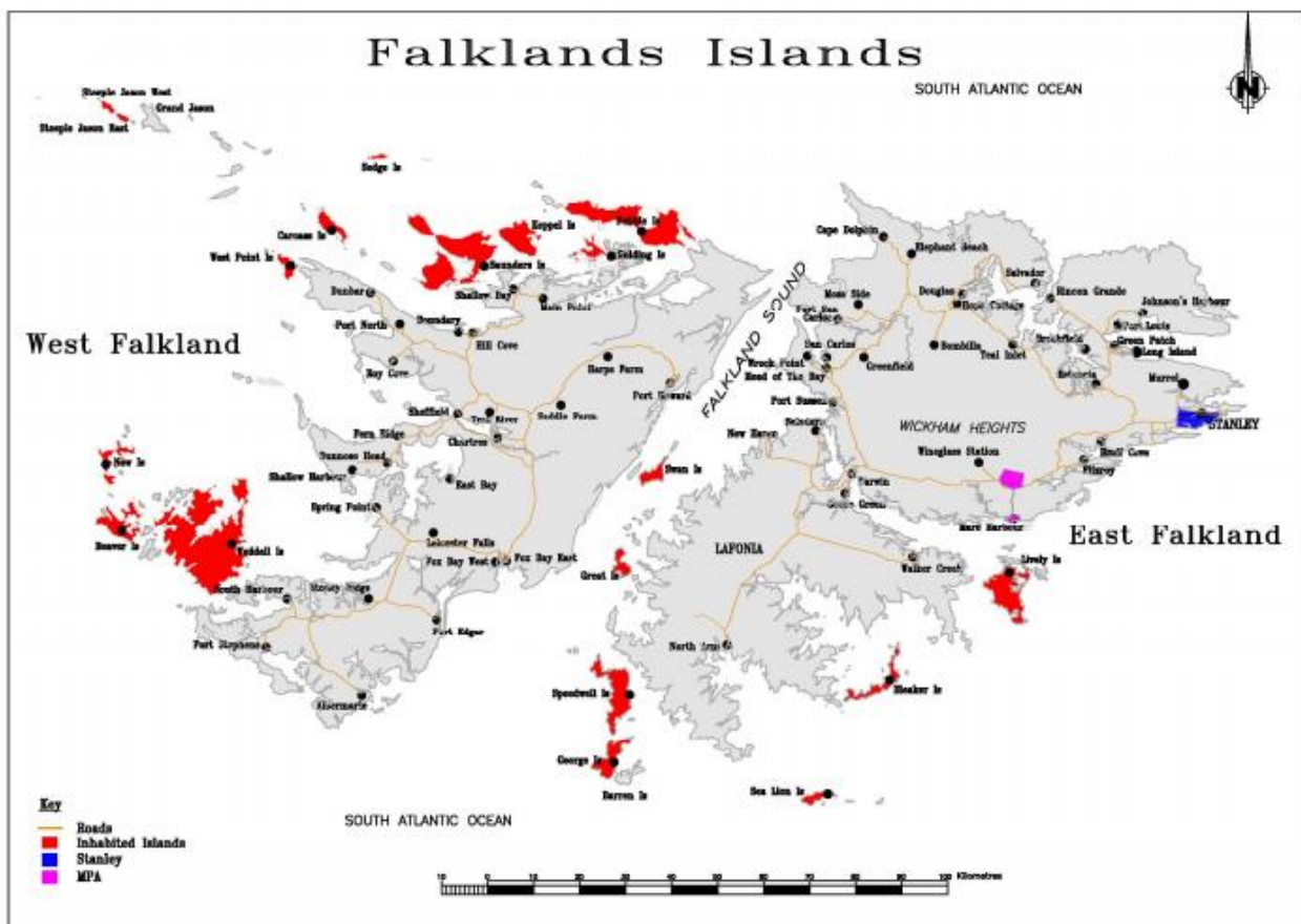
Figura 3.1. Islas Malvinas zonas donde habitan