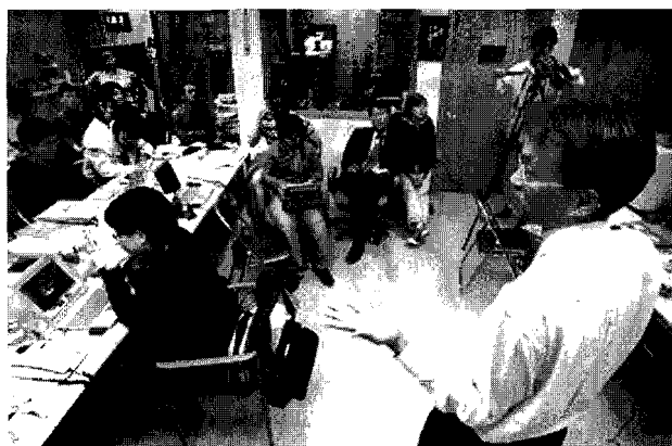
Maestros jóvenes del nuevo formato periodístico

En primer lugar, y en relación al soporte, cabe destacar que es más difícil y cansino leer en la pantalla de un ordenador que en el papel. Por este motivo, y también debido a la rapidez con la que el lector on-line pretende informarse, en el Internet se tiende a acortar los textos. Se trata de sintetizar y resumir las noticias. El objetivo es describir correctamente todos los detalles importantes del acontecimiento, pero evitando redactar artículos excesivamente largos que, sin embargo, sí tendrían cabida y sentido en la pren-