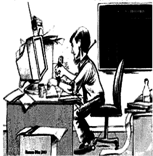
La transición del caos documental al orden informático

sobre un encabezado éste cambia de aspecto indicando así al lector que se trata de un enlace que remite al texto íntegro de la noticia.