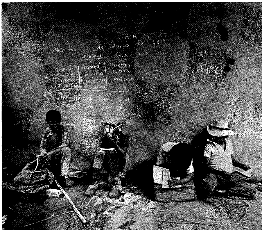
Los niños desplazados por la guerra estudian rodeados de privaciones