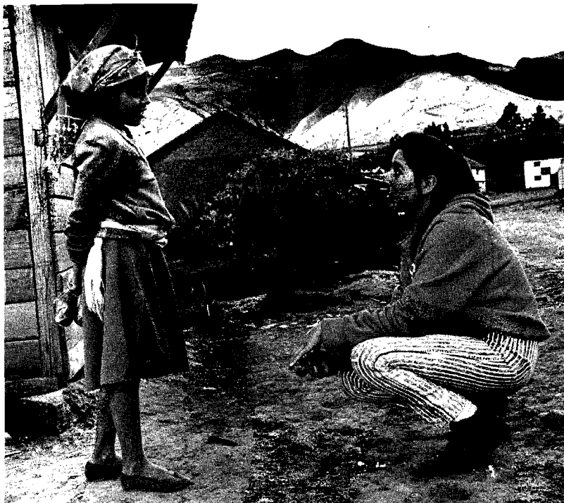
Escuchando a una niña entre montañas