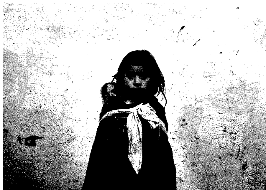
Contra la espada y la pared

No lo creo, porque al decir a la educación por la comunicación estoy afirmando precisamente que el punto de partida es la comunicación para llegar a lo educativo; al menos esa es la intencionalidad del libro. En otras palabras, lo que quiero afirmar es que se trata de una educación permeada por los flujos de la comunicación.