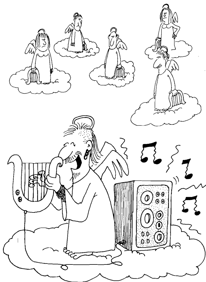
Almeida, MUSIJA, Punto Sur Editores, Uruguay, 1987

Una vez que el oyente llega a ser "monitor" la correspondencia se hace más fluida, personal y dedicada. Mediante "Hojas Tipo" remitidas por la propia emisora, el monitor hace saber mensualmente a los técnicos y programadores sobre la calidad de las transmisiones. Si llegaron o no con interferencias, clases