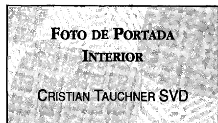
FOTO DE PORTADA INTERIOR