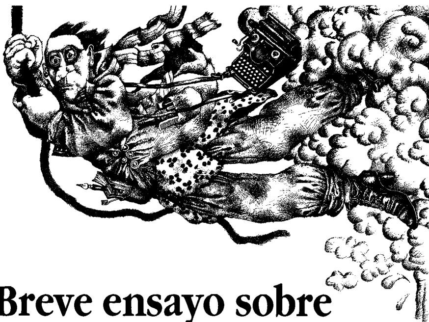
Tullio Pericoli, Italia, 1985