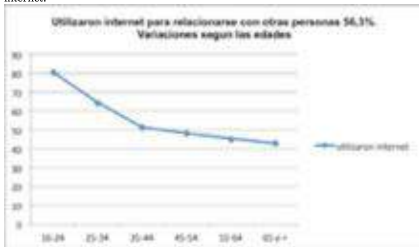
Gráfico 1. Porcentajes de internautas que se relacionaron con otras personas a través de internet.