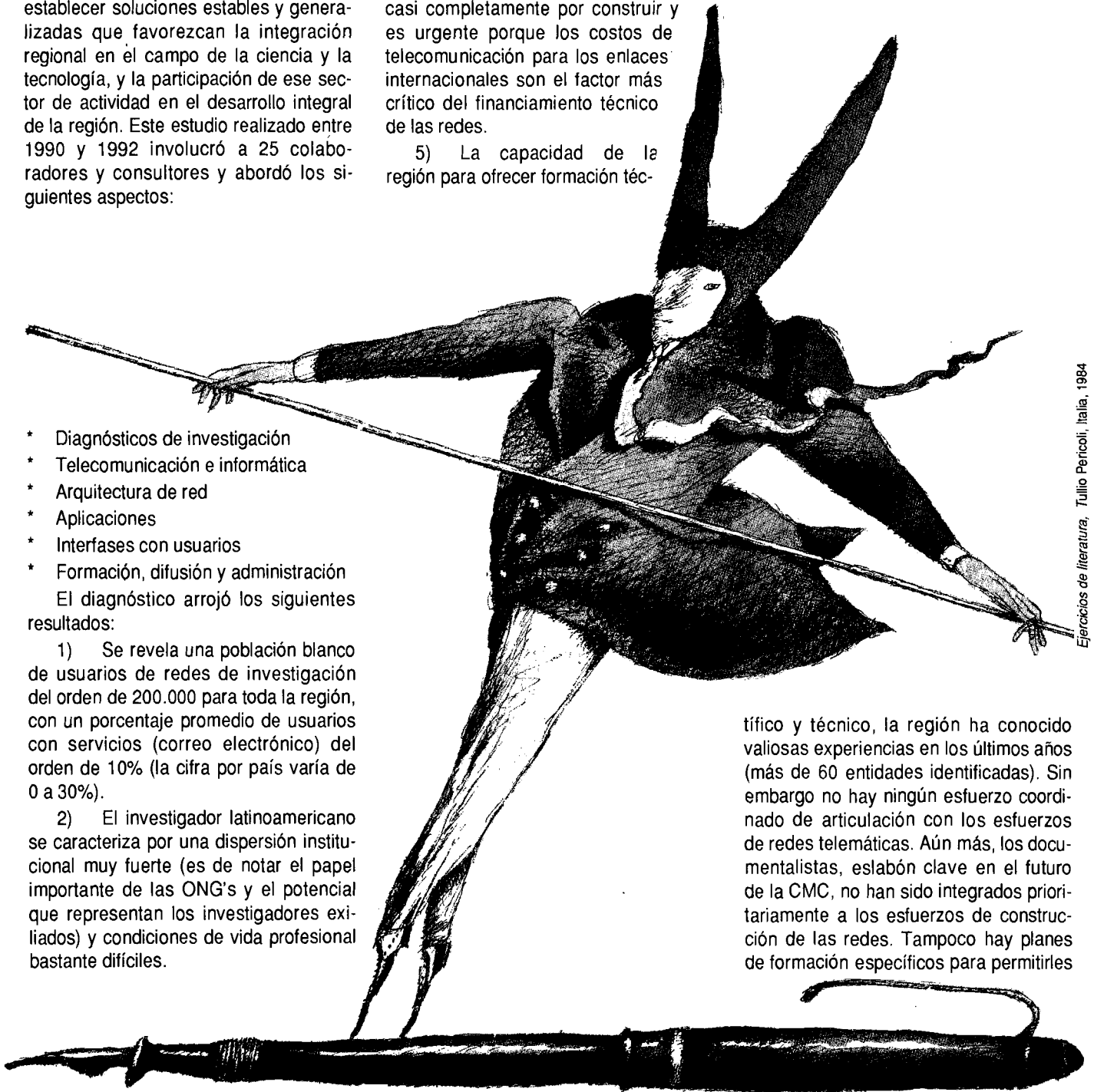
Ejercicios de literatura, Tullio Pericoli, Italia, 1984

tífico y técnico, la región ha conocido valiosas experiencias en los últimos años (más de 60 entidades identificadas). Sin embargo no hay ningún esfuerzo coordinado de articulación con los esfuerzos de redes telemáticas. Aún más, los documentalistas, eslabón clave en el futuro de la CMC, no han sido integrados prioritariamente a los esfuerzos de construcción de las redes. Tampoco hay planes de formación específicos para permitirles