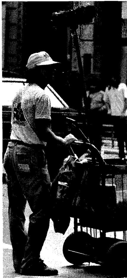
Barrendero de la Intendencia Municipal de Montevideo.

El relato que sigue no es necesariamente fidedigno ni completo; demasia-