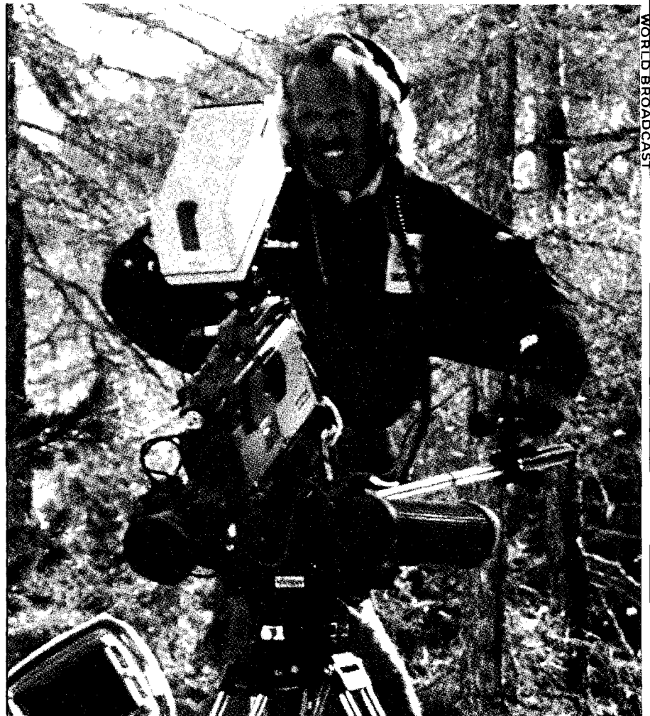
Para CIESPAL es fundamental la formación teórica-práctica del comunicador de TV

Este año, 1991, ha sido fructífero en la vida de CIESPAL, en tanto que ha marcado el inicio de sus actividades en el campo de la televisión; pero al mismo tiempo, exige que su presencia continúe con los niveles de excelencia que ha sido su tradición. Los próximos años deberán responder a las expectativas creadas en torno a este proyecto y, lo que es más importante, contribuir al desarrollo de la comunicación de América Latina. ■