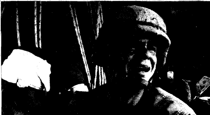
Tras la guerra, dolor y tristeza