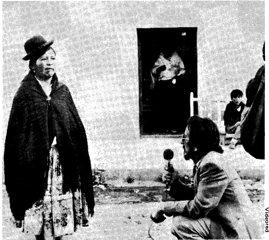
El campo reclama de un mayor acceso a los medios

La preferencia de canales por parte de los sectores populares quiteños menosprecia a aquellos que tienen un carácter educativo-cultural: Canal 13 y ORTEL , pues de estos dos que tienen salida únicamente en la capital, apenas el primero es preferido por el 1 por ciento de los televidentes, mientras que el segundo ni siquiera es mencionado. Si bien ésta no es una coincidencia en los sectores populares analizados (pues en las