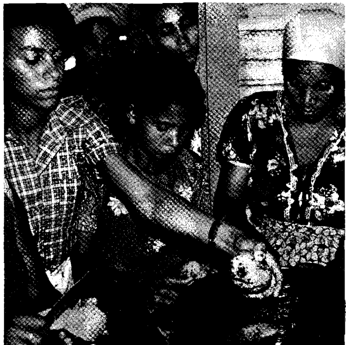
El desarrollo de los sectores marginales debe apoyarse en los medios

La mayoría de los campesinos escuchan la radio pero aman la televisión. En Quito se leen menos periódicos que en Guayaquil. El Comercio de Quito y el Universo de Guayaquil son los diarios preferidos. Y las redes comunitarias funcionan muy bien en la costa.