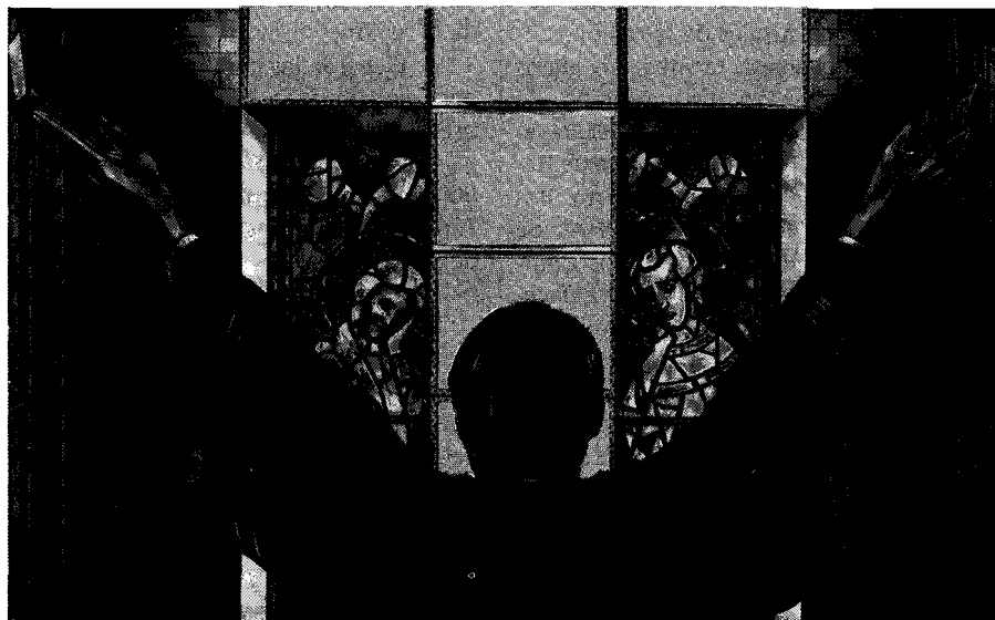
Requiem por Sutatenza

En cuarto lugar, es necesario tener en cuenta que debido a factores personales, el liderazgo de la Institución estuvo muy vinculado a la persona del líder dirigente y solo ahora, en el proceso de reconstrucción de la Fundación Acción Cultural Popular que se ha iniciado a partir de mediados de 1989, se han logrado vincular nuevos cuadros dirigentes. ■