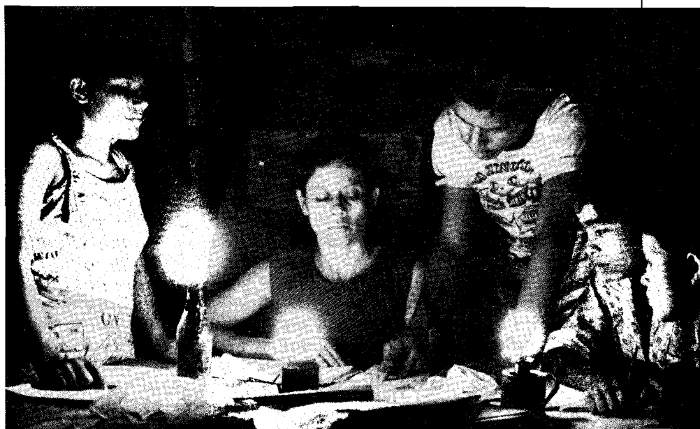
El campesino colombiano recuerda con pesar a la cadena Sutatenza

De doce millones de habitantes, (siete eran campesinos), a comienzos de los años cincuenta Colombia salta a más de 30 millones de habitantes en la actualidad. De ellos solo 8 millones pueden denominarse campesinos.