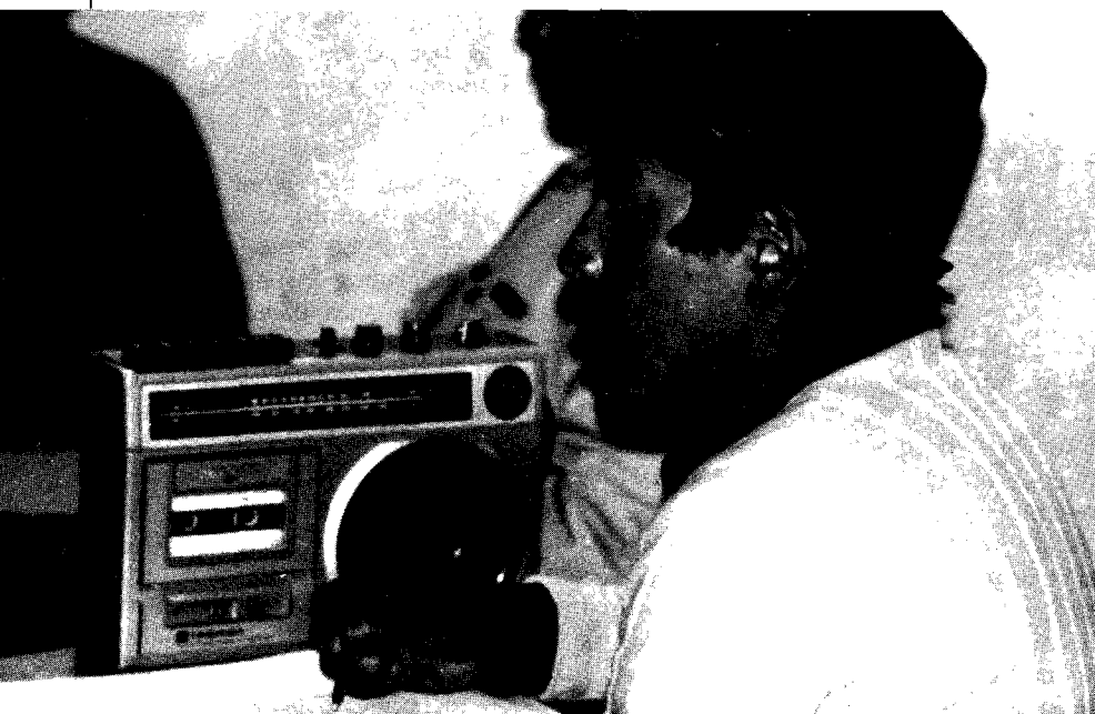
La experiencia de ACPO enfatizó el concepto de una alfabetización funcional

Voces Múltiples — Ideología. Demasiado apretada es la síntesis de una filosofía social, sobre la cual se han escrito libros, múltiples artículos, folletos y libretos. Filosofía que además pretendía traducirse en 19 horas diarias de programación radial, si bien nunca se logró a cabalidad. Conceptos y contenidos que dieron origen a programas tan concretos como el de la Biblioteca Campesina con más de cien títulos al alcance no solo de la mentalidad, sino principalmente del bolsillo de los pobres y marginados. Su lanzamiento se hizo cambiando "un libro por un huevo". Algunos de ellos fueron