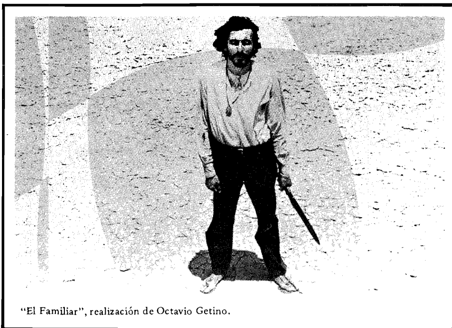
"El Familiar", realización de Octavio Getino.

Sin embargo, si nada de esto existe -ni tampoco ningún otro tipo de alternativas que pudieran probarse como eficaces para el desarrollo de los espacios de